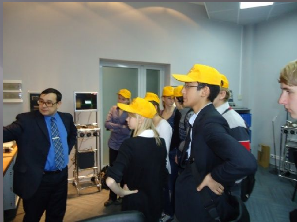
Этап игры "Центровая команда" - «Профориентационная игра»