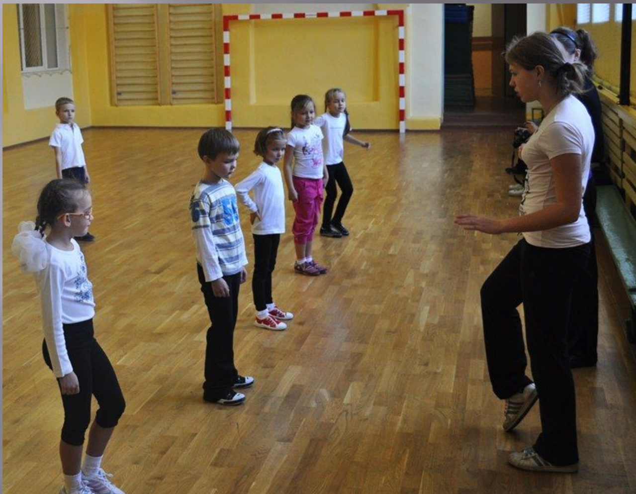
Сегодня в качестве учителей физкультуры - ученицы 10-б класса