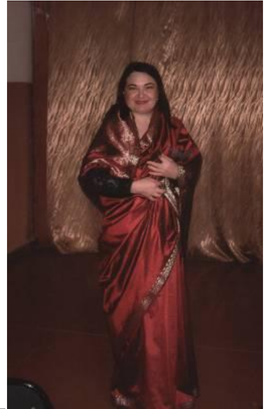
Встреча с представителем этой культуры