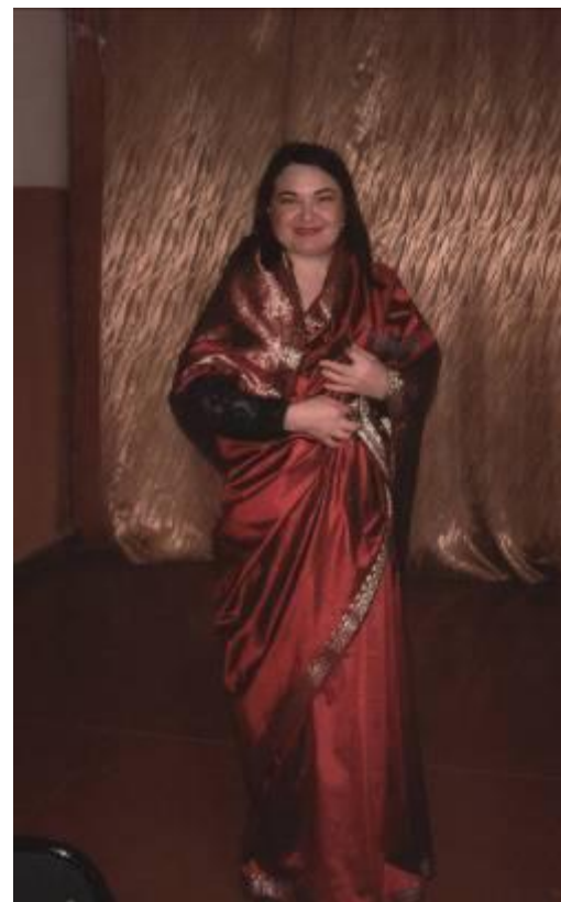
Встреча с представителем этой культуры