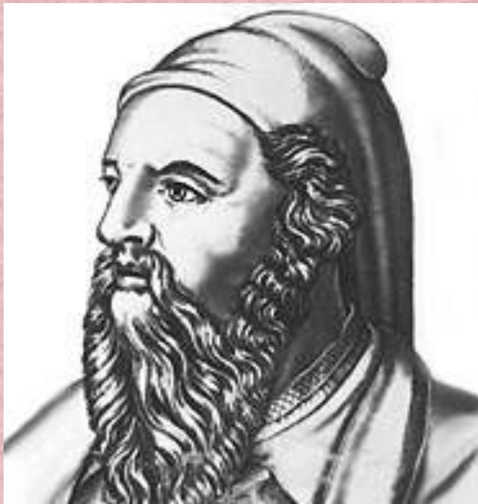
Пифагор Самосский ( 500-580 гг. до н. э.)