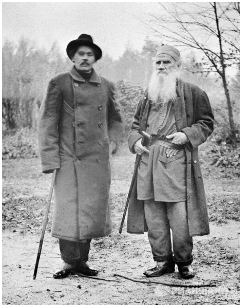
Бывал в Ясной поляне и Максим Горький.