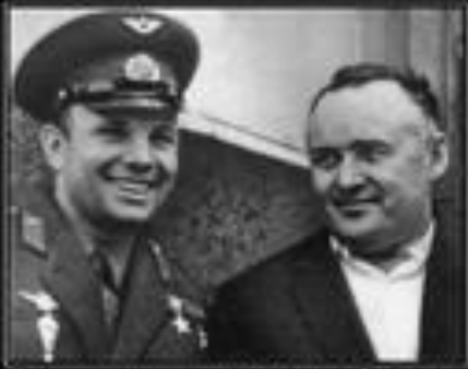
Они не адвастались, не тырели близнца. Они тырели на свое менту, а победиле.