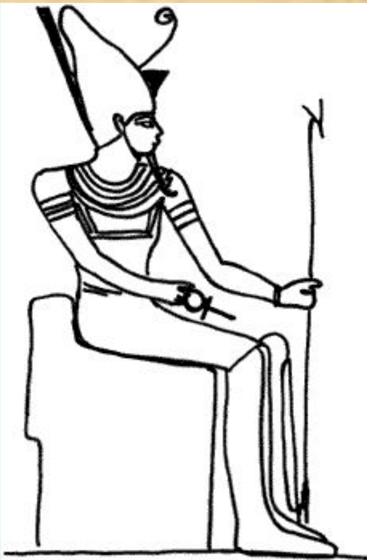
Атум — солнце на закате.