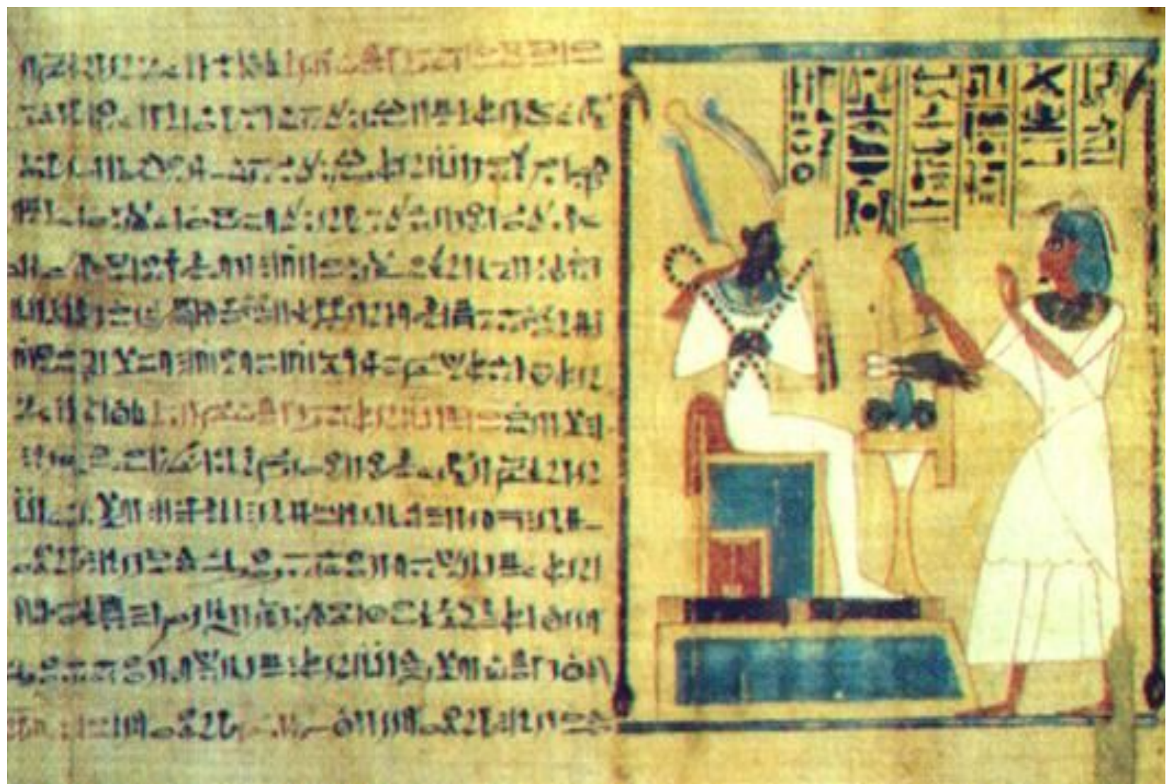
Исида и Анубис - проводники душ в царство мертвых. Рисунок из «Книги мертвых».