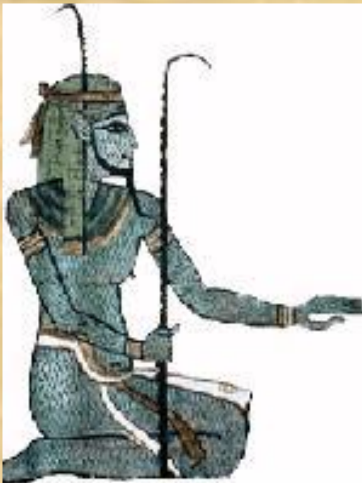
Нун — бог-океан.