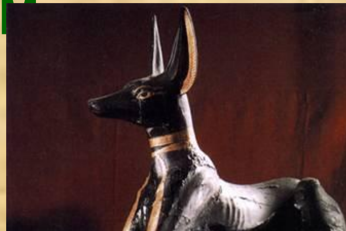
Шакал – бог Анубис