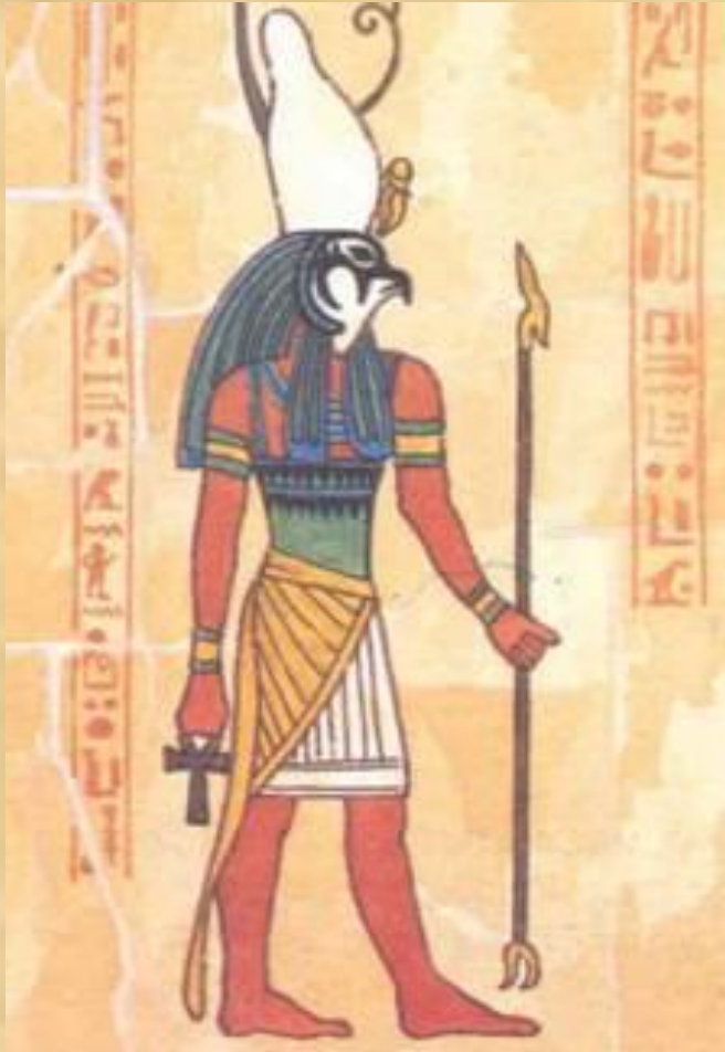
Бог Хор (Гор)