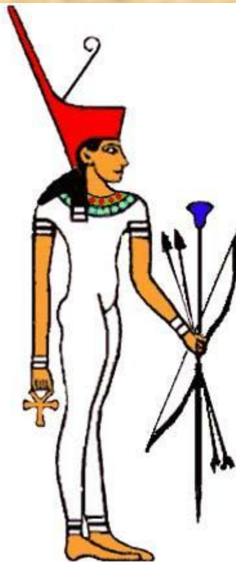
Нейт, богиня охоты, особо почиталась в египетском номе Саис.