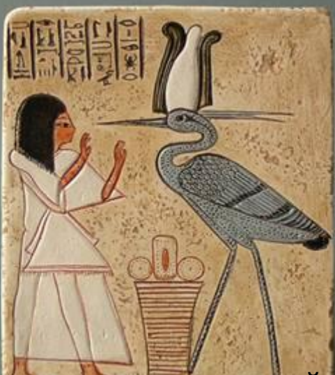
Поклонение священной цапке