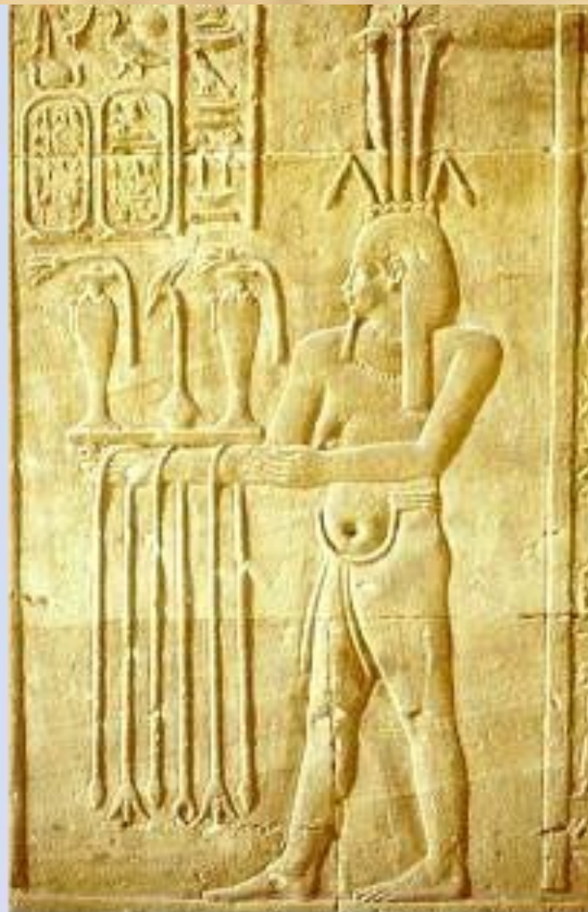
Хапи — бог реки Нил.