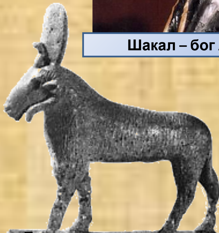
Баран – священное животное бога Ра