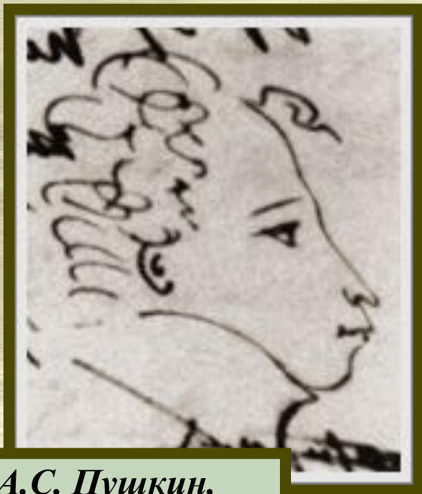
А.С. Пушкин. Автопортрет

Кто даёт вам право спрашивать – Нужен Пушкин или нет? Неужели сердца вашего Недостаточен ответ?