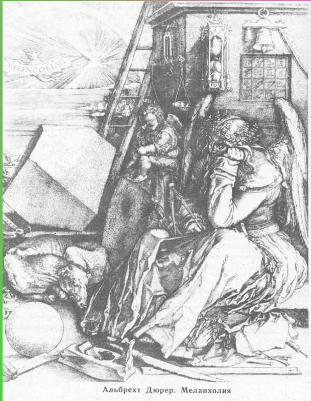
Альбрехт Дюрер. Меланхолия