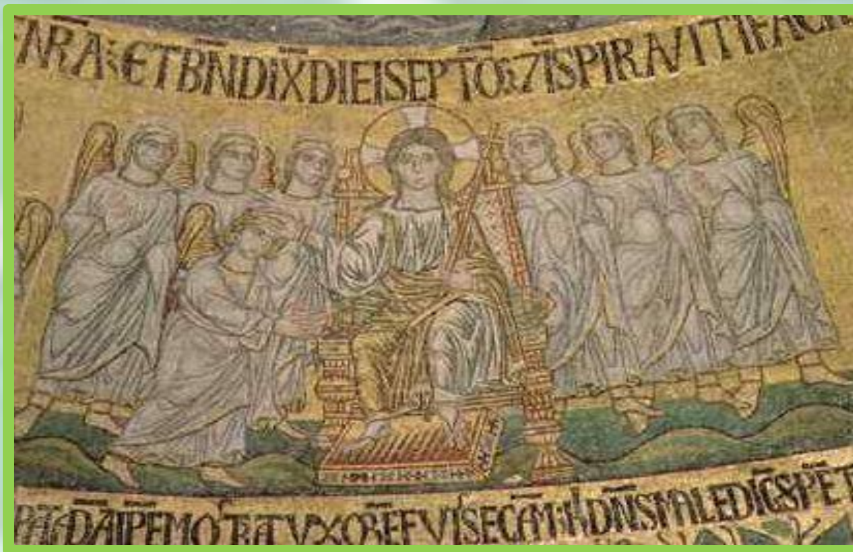
Благословение седьмого дня

И благословил Бог седьмой день и освятил его, ибо в оный день почил от всех дел Своих, которые творил и созидал.