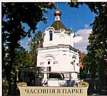
ЧАСОВНЯ В ПАРКЕ ИМ. Г.К. ЖУКОВА

ПАРК ИМЕНИ Г.К. ЖУКОВА ПЕРЕД ЗДАНИЕМ АДМИНИСТРАЦИИ КРАСНОДАРСКОГО КРАЯ