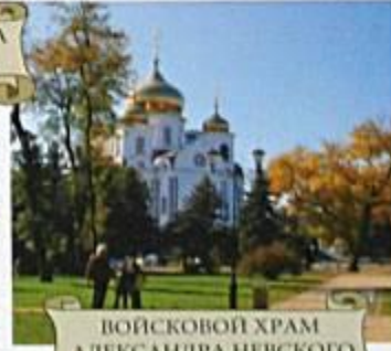
ВОЙСКОВОЙ ХРАМ АЛЕКСАНДРА НЕВСКОГО