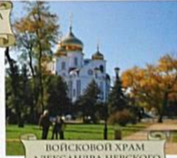
ВОЙСКОВОЙ ХРАМ АЛЕКСАНДРА НЕВСКОГО