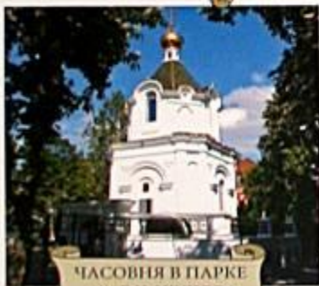
ЧАСОВНЯ В ПАРКЕ ИМ. Г.К. ЖУКОВА