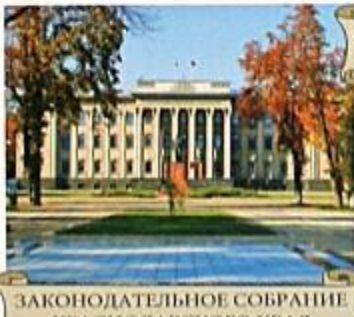
ЗАКОНОДАТЕЛЬНОЕ СОБРАНИЕ КРАСНОДАРСКОГО КРАЯ