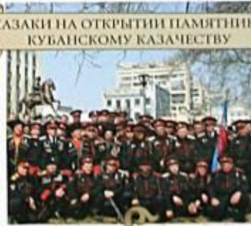
КАЗАКИ НА ОТКРЫТИИ ПАМЯТНИКА КУБАНСКОМУ КАЗАЧЕСТВУ