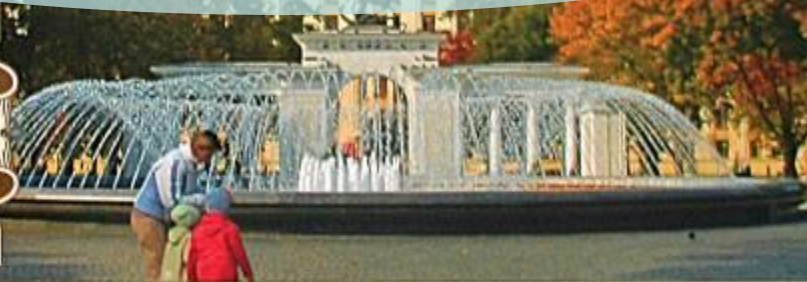
ПАРК ИМЕНИ Г.К. ЖУКОВА ПЕРЕД ЗДАНИЕМ АДМИНИСТРАЦИИ КРАСНОДАРСКОГО КРАЯ

Город Краснодар — крупнейший административный, промышленный и культурный центр Краснодарского края, был основан черноморскими казаками в 1793 г. До 1920 г. назывался Екатеринодаром, в честь русской императрицы Екатерины II. В нем гармонично сочетаются самобытные традиции прошлых лет с ритмом современной жизни.