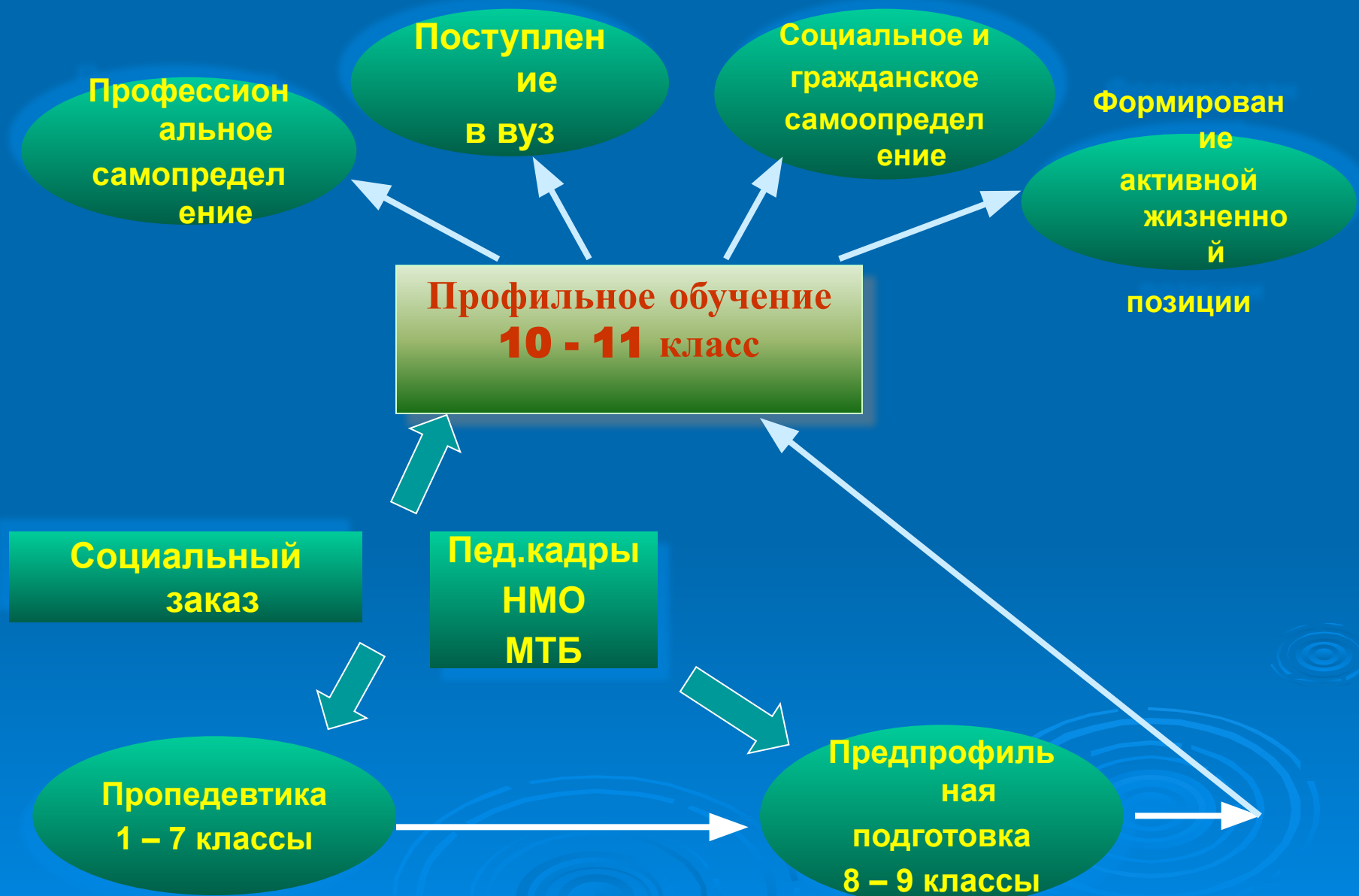
Схема внутришкольной профилизации