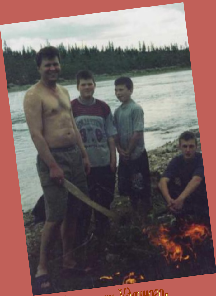
Белые ночи Удачного.