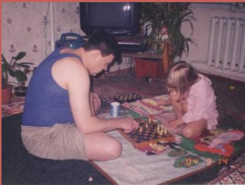
Борьба за II место. (Мама - на I).