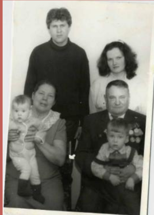
Бабушке с дедушкой по внуку