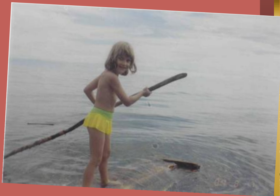
Осваиваем байкальские просторы.