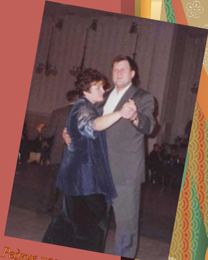
Редкие часы наедине...