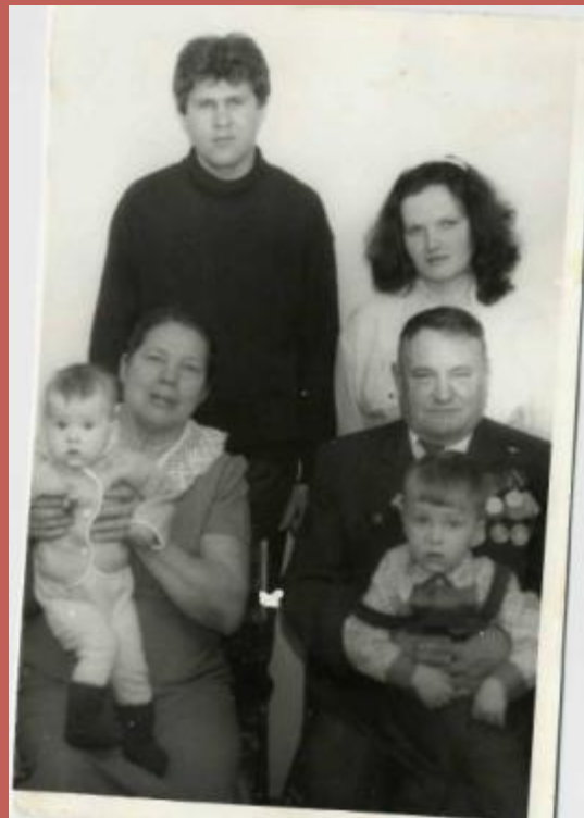
Бабушке с дедушкой по внуку