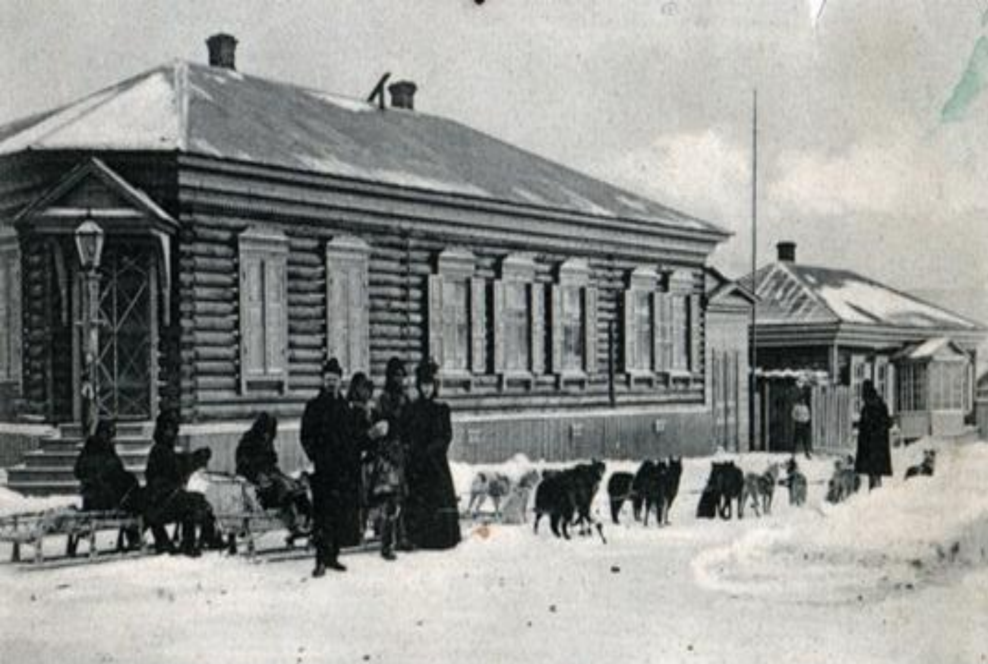
Николаевскъ и Амуръ Nikolajefsk a/Amur