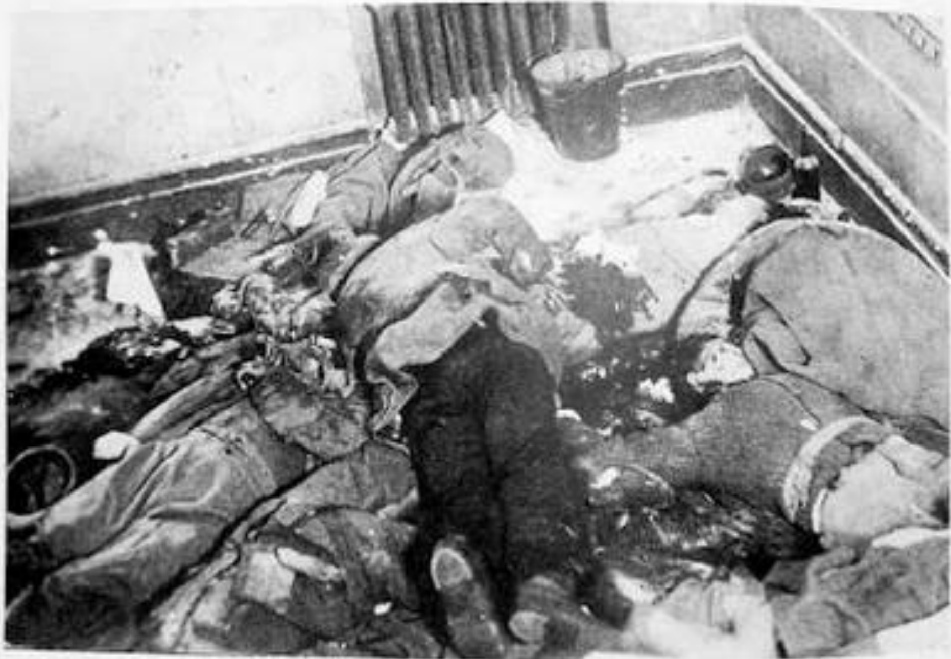
19. Victims of the Red terror