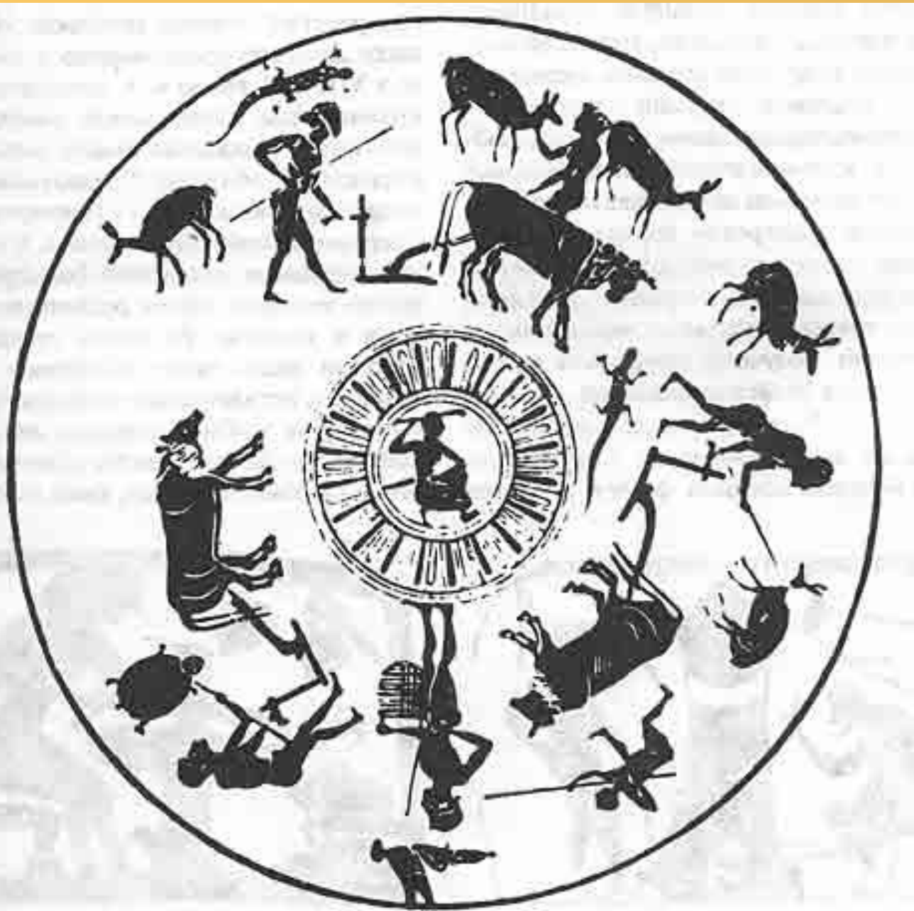
Сцены пахоты. Вазопись