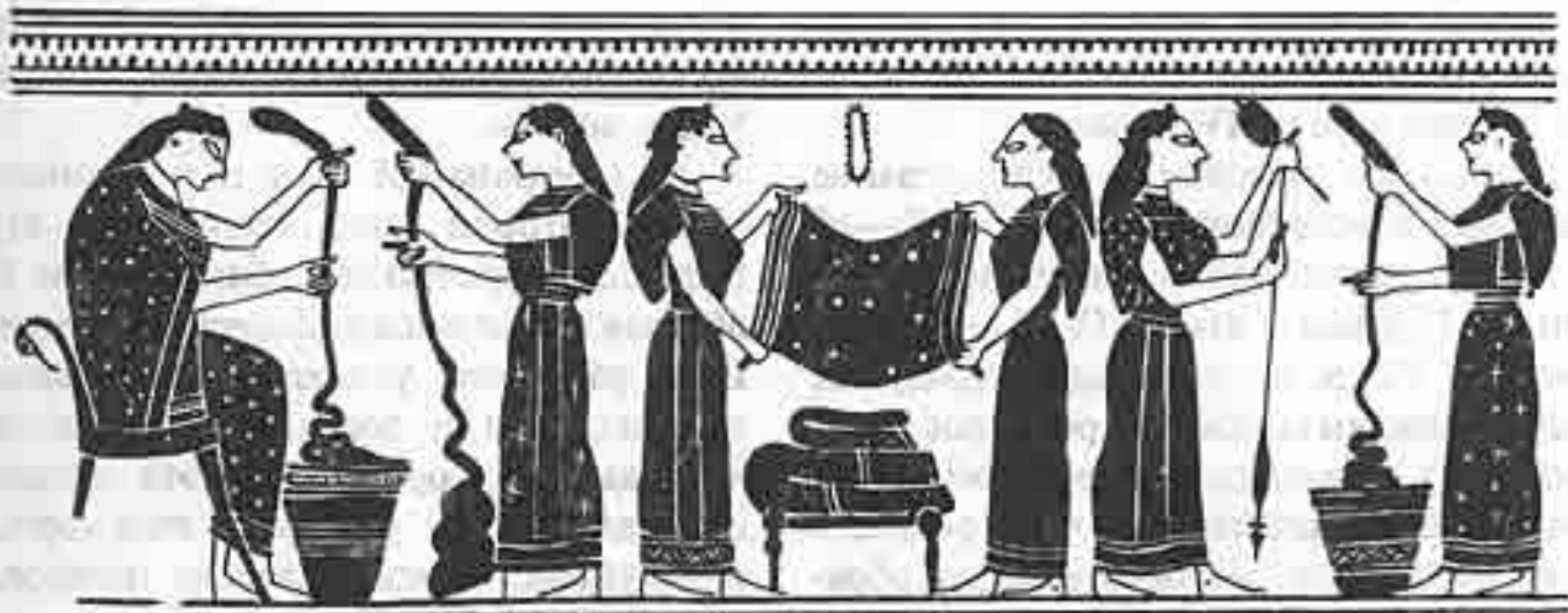
Изготовление тканей. Вазопись