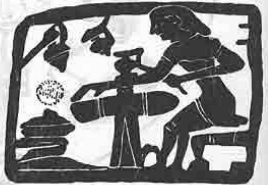
Гончар за работой. Вазопись