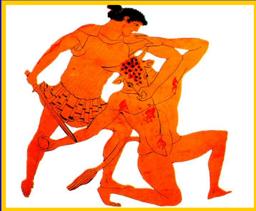
Тесей и Минотавр. Рисунок на критской вазе.

Одним из самых известных мифов посвященных Криту был миф о Тесее и Минотавре