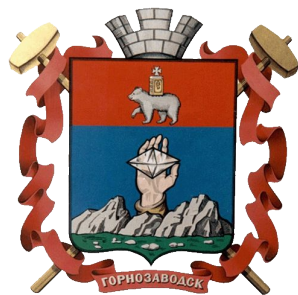
герб Горнозаводска, 2000

Герб муниципального образования «Горнозаводский район» ведет свое начало из истории данного района. Тема возникает из естественных гербовых фигур (человеческая рука, держащая кристалл, горы) которые характерны для муниципального образования «Горнозаводский район», являются неотъемлемой частью историко- географического обозначения. Кристалл, возникший из горных недр в человеческой руке, говорит о нахождении здесь первого российского алмаза в 1829 году, о сметных природных богатствах, находящихся на горных массивах района. Тема герба подсказана и исторически сложившимся наименованием «Горнозаводск», именно так именовали этот район с 18 века. Природная кладовая Уральских гор, открыв свои богатства человеку, подсказала ему и географическое название - Горные заводы, промышленность в горах. Поэтому геральдическая фигура гор убеждает в том, что город находится в горах, которые покоятся на зеленом ковре растительности. В верхней части пересеченного щита находится герб Пермской области, подчеркивающей нахождение муниципального образования «Горнозаводский район» на территории Пермской области.