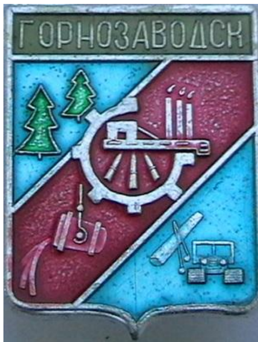
Значок – эмблема города Горнозаводска