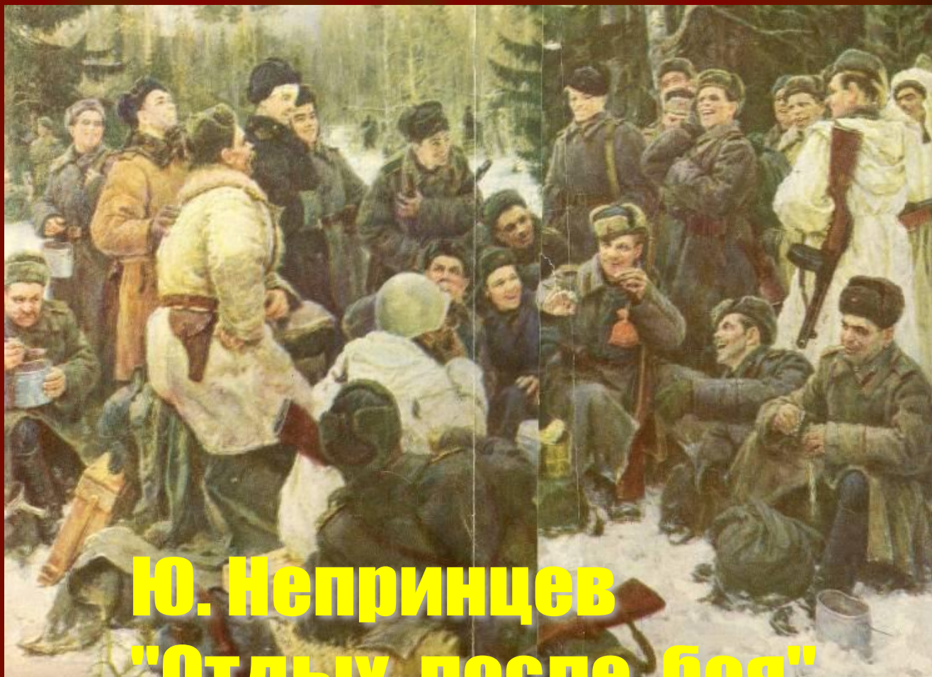
Ю. Непринцев "Отдых после боя"