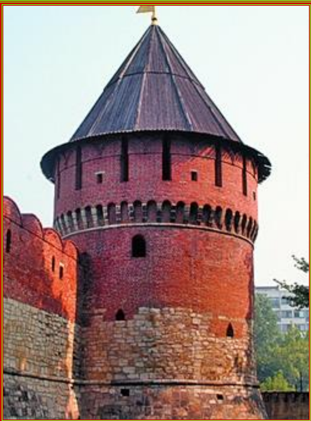
Ивановская (Тайницкая) башня