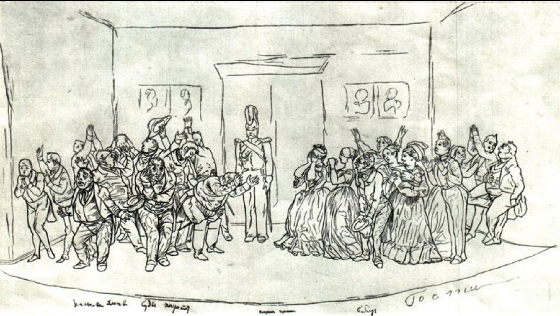
«РЕВИЗОР». ЗАКЛЮЧИТЕЛЬНАЯ СЦЕНА. Рисунок Н. В. Гоголя (?)