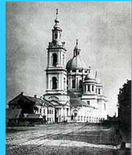
Церковь, где крестили Пушкина