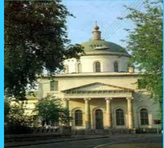
Храм Вознесения, где венчался Пушкин с Гончаровой