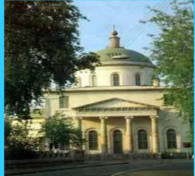
Храм Вознесения, где венчался Пушкин с Гончаровой