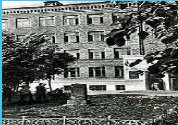
Школа, где учился А.С. Пушкин

Москва - это город, где Пушкин родился и провел свое детство, где навсегда подружился с книгами и стал писать свои первые стихи.