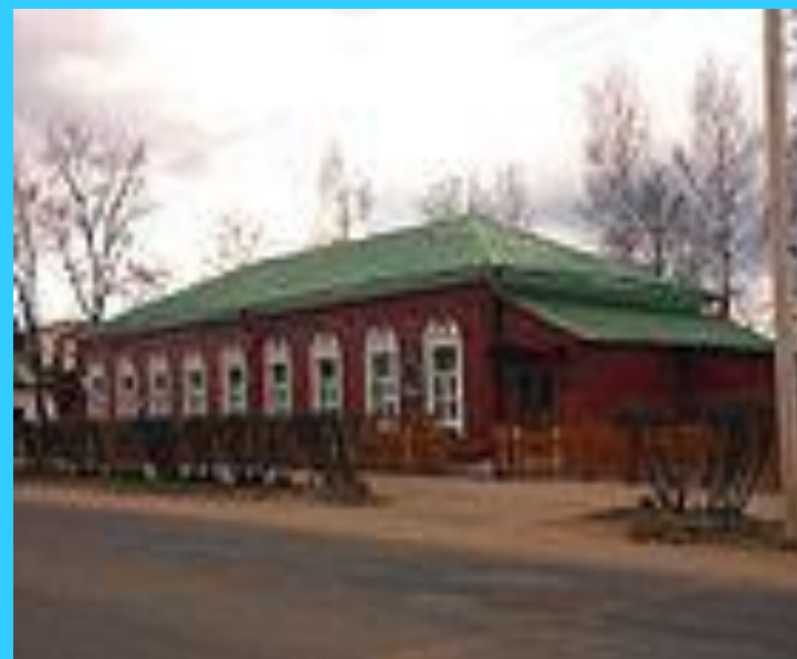
Музей А.С. Пушкина