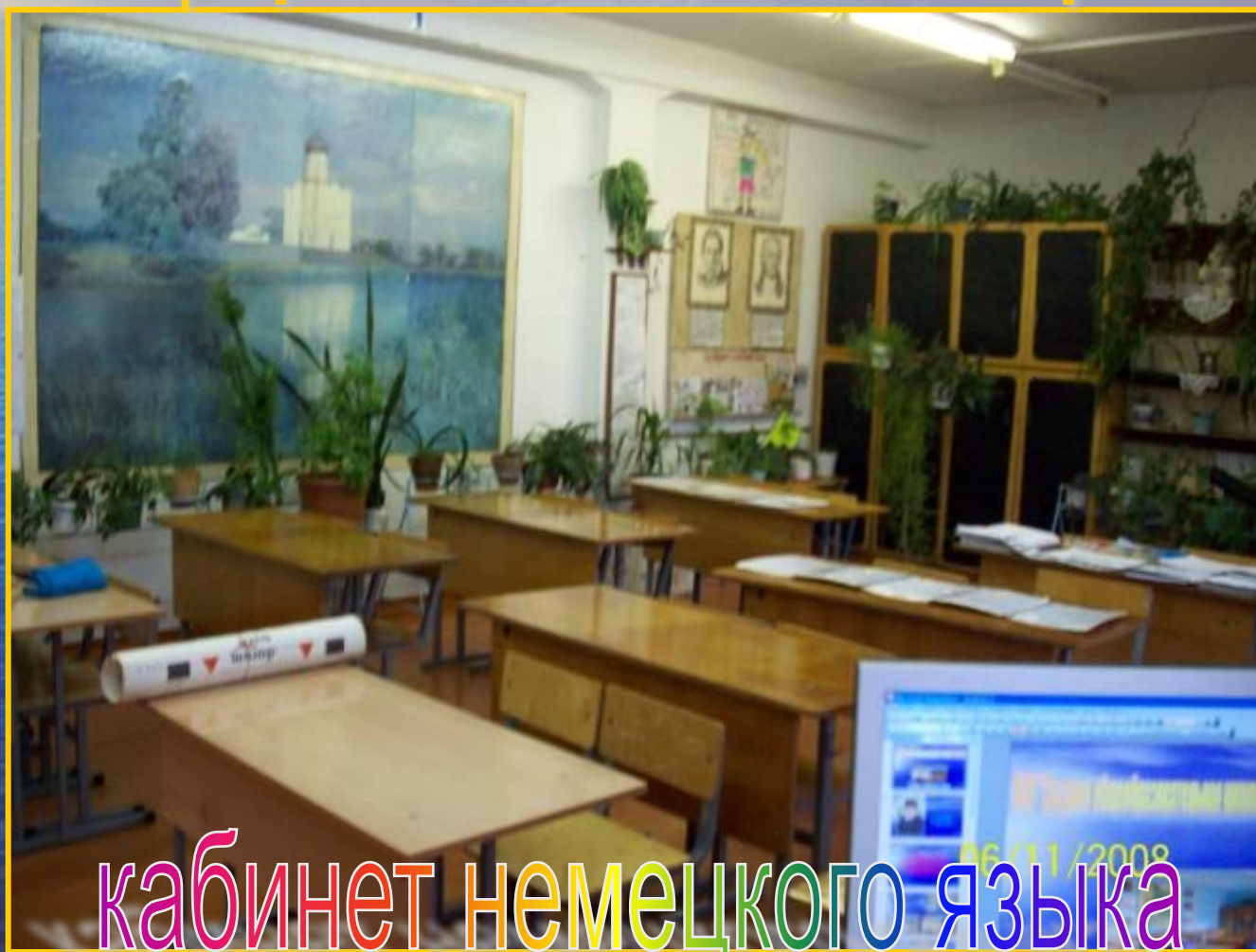
кабинет немецкого языка