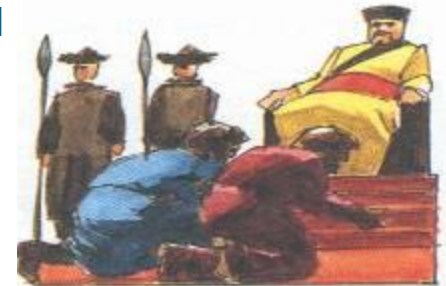
△ В 1275 г. Поло добрались до летнего дворца Хубилай-хана в Ченду. Хан расспросил их о путешествии.