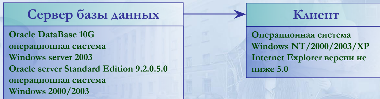
Схема в трехзвенной архитектуре