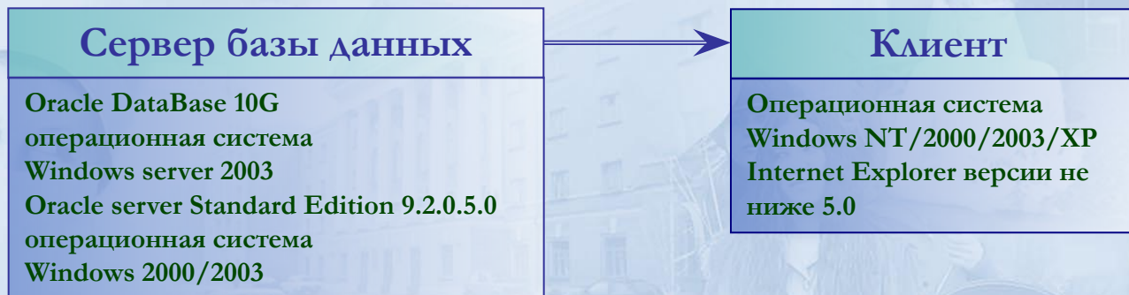
Схема в трехзвенной архитектуре