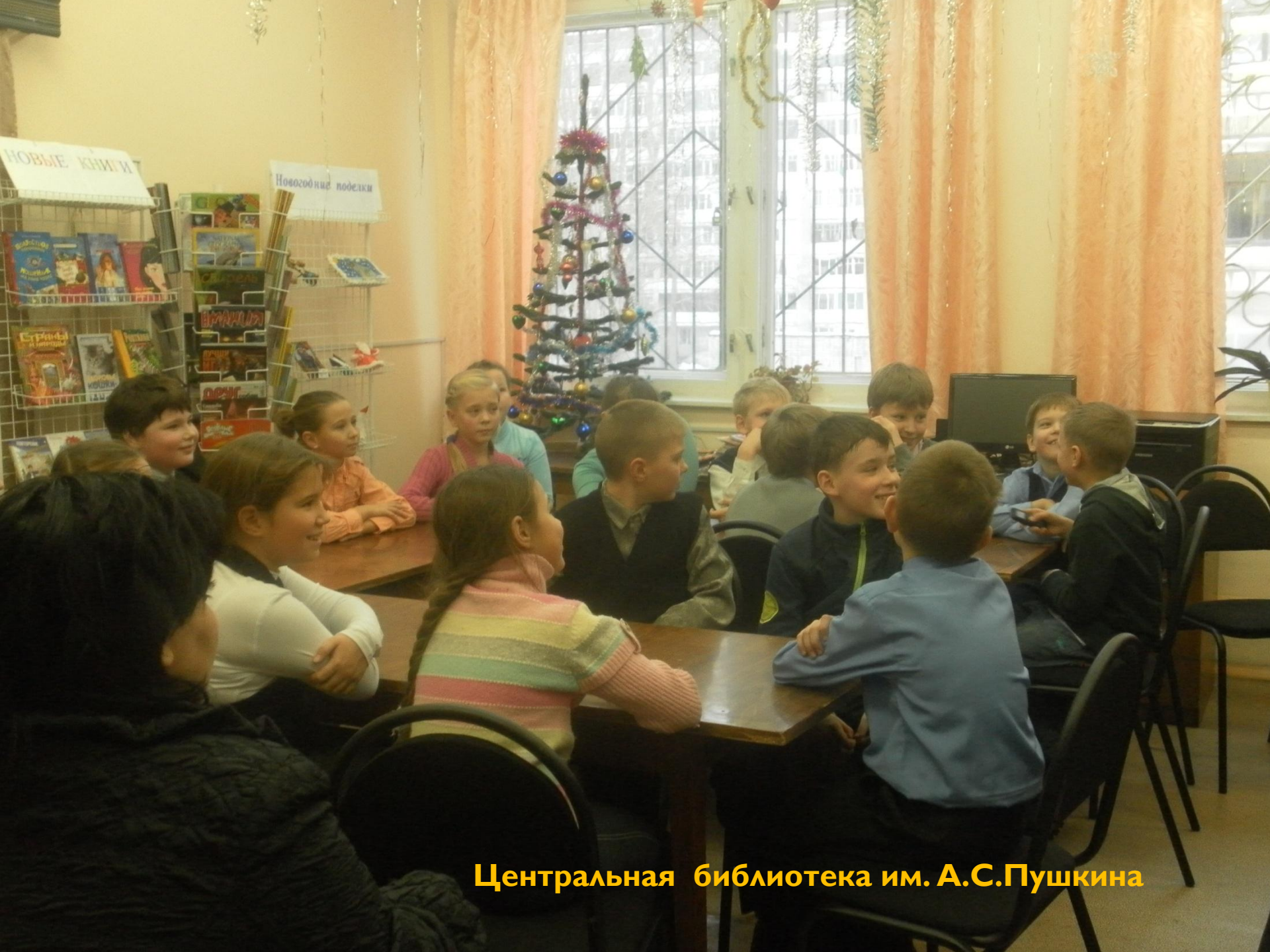
Центральная библиотека им. А.С.Пушкина