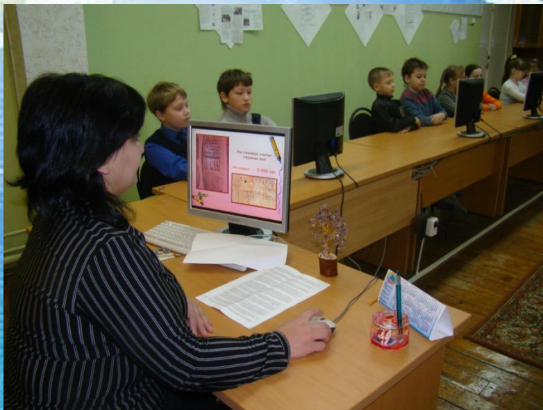
Библиотечный урок «О книге и библиотеке» в 4 классе