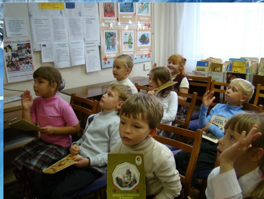
Библиотечный урок «Структура книги» во втором классе