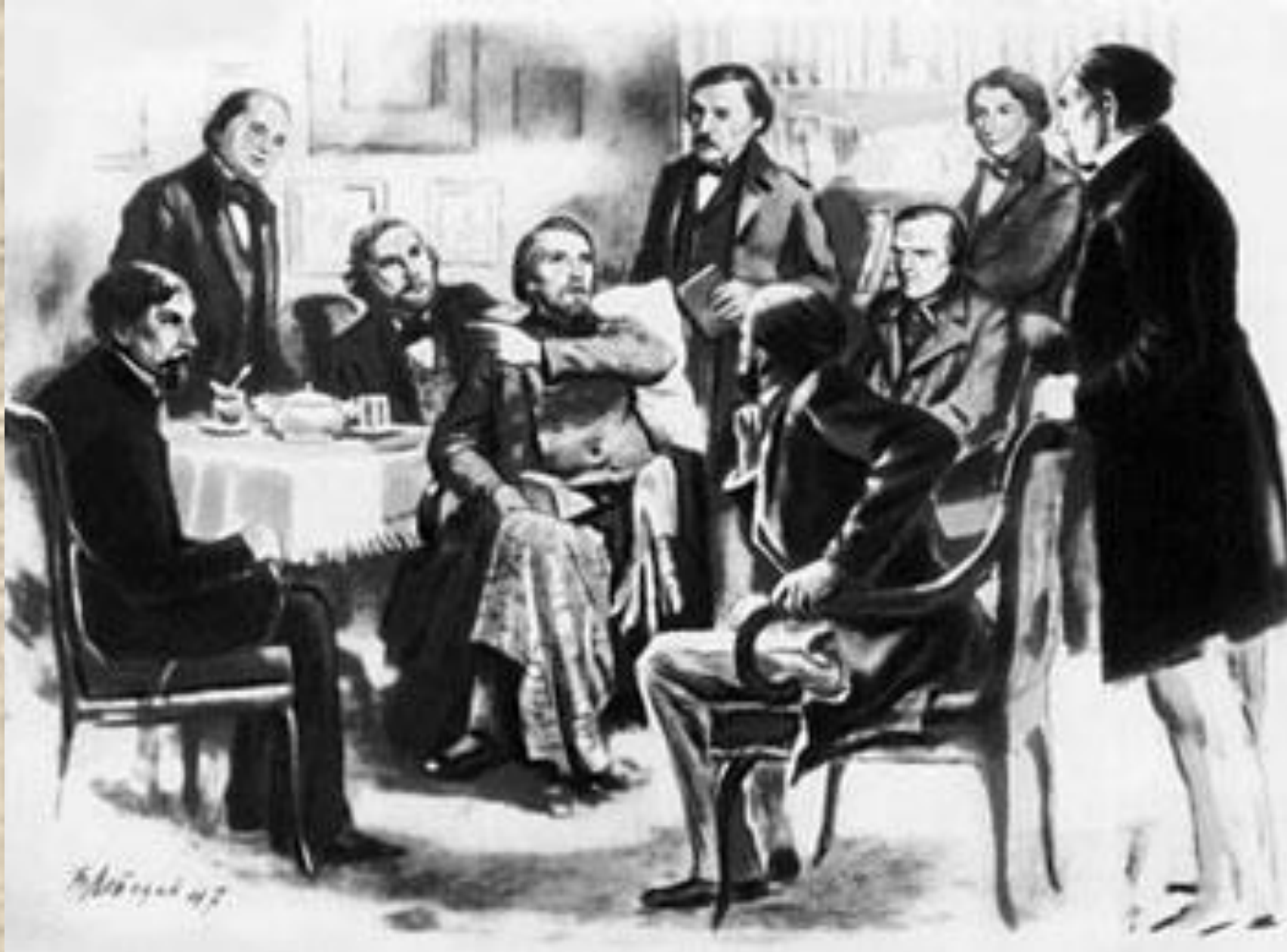
Петербургский кружок литераторов вокруг В.Г. Белинского.