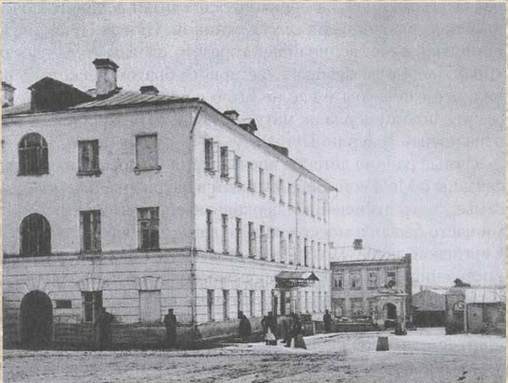
Правый флигель Мариинской больницы для бедных, где родился Ф.М.Достоевский