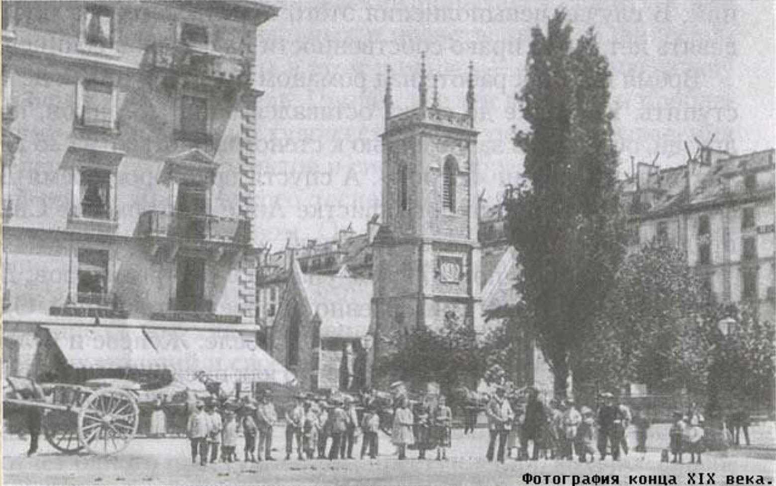
Фотография конца XIX века.

Дом в Женеве, где жили Достоевские во время поездки в Европу