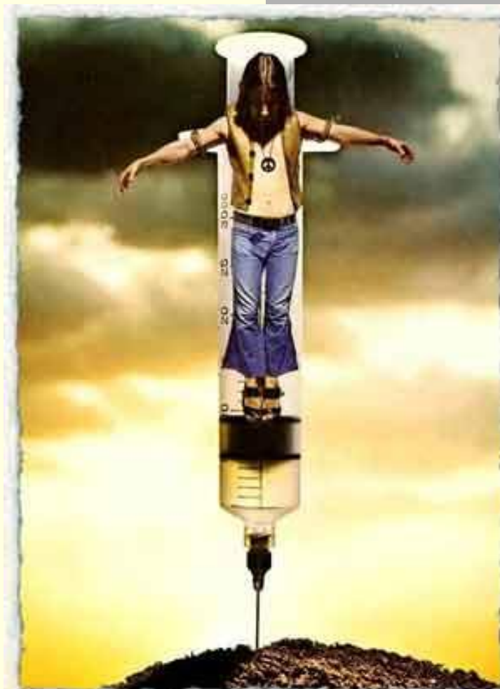
1971 г. "Современное распятие". Из ж-ла Mad, сент. 1971.