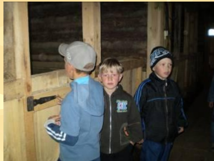
ООО «Савино 1»