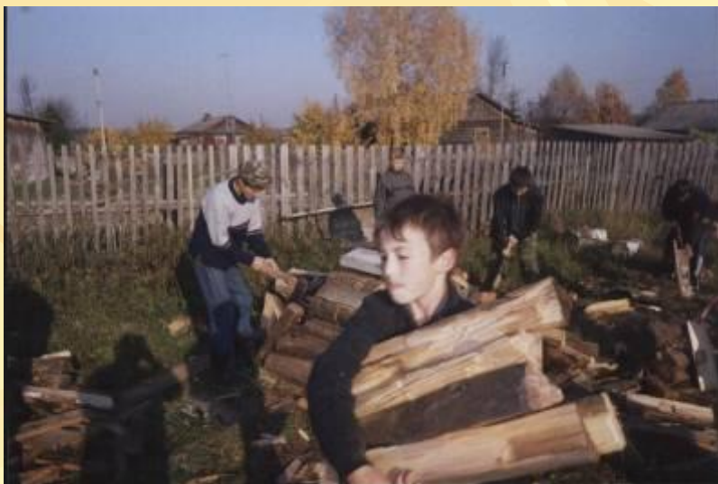
Акция «Вместе поможем ветеранам»