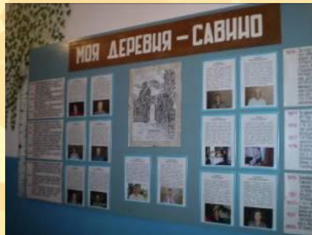
Стенд «Моя деревня»