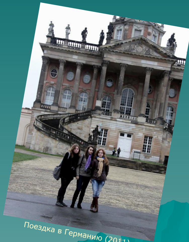
Поездка в Германию (2011)