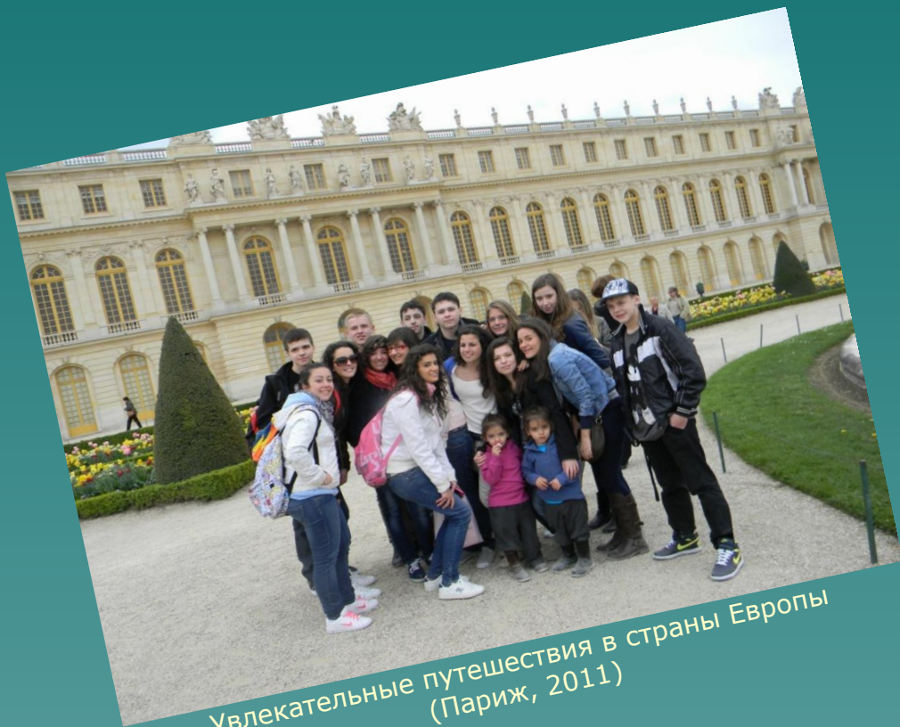
Увлекательные путешествия в страны Европы (Париж, 2011)

В рамках развития диалога культур традиционно организуются поездки в зарубежные страны, изучение культуры памятников народов мира.