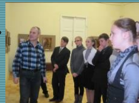
РГИА и ХМЗ

Человек Семья Культура Отечество Знания Труд Земля