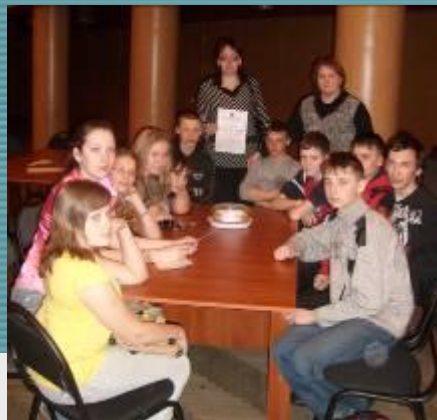
Школа выживания Азбука туризма Гимнастика