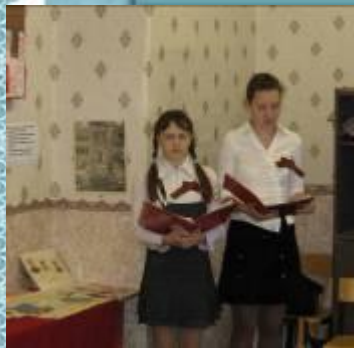
Пресс-центр Литературное краеведение