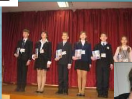
Центр «Молодые таланты»