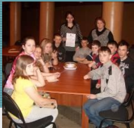
Школа выживания Азбука туризма Гимнастика