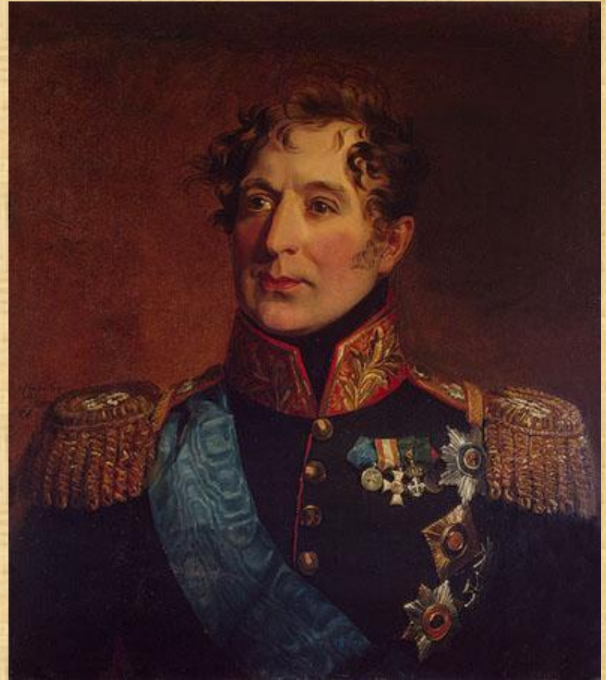
Генерал Михаил Милорадович

В 1812 году вступил в московское дворянское ополчение и состоял при генерале Михаиле Милорадовиче; под Бородином отличился, вынеся из огня раненого генерала; за Бородинское сражение получил орден святого Станислава 4-й степени. После сдачи Москвы князь вышел в отставку и уехал к семье.