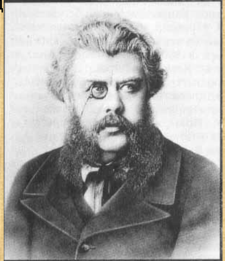
Павел Петрович Вяземский

Своего отца пережил только Павел, да и то всего лишь на 2 года.