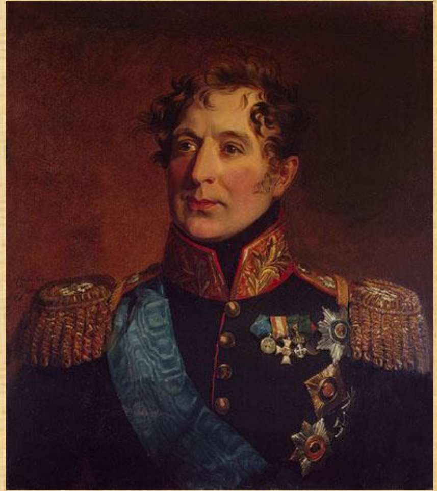
Генерал Михаил Милорадович

В 1812 году вступил в московское дворянское ополчение и состоял при генерале Михаиле Милорадовиче; под Бородином отличился, вынеся из огня раненого генерала; за Бородинское сражение получил орден святого Станислава 4-й степени. После сдачи Москвы князь вышел в отставку и уехал к семье.