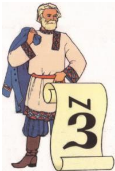
В Древней Руси