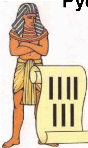
В Древнем Египте