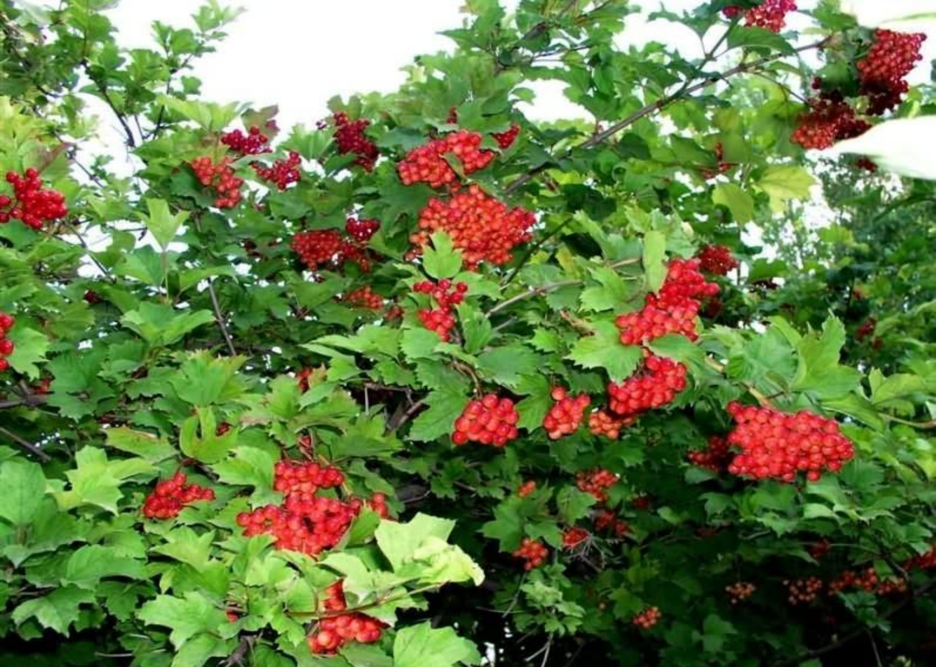
Калина – это кустарник