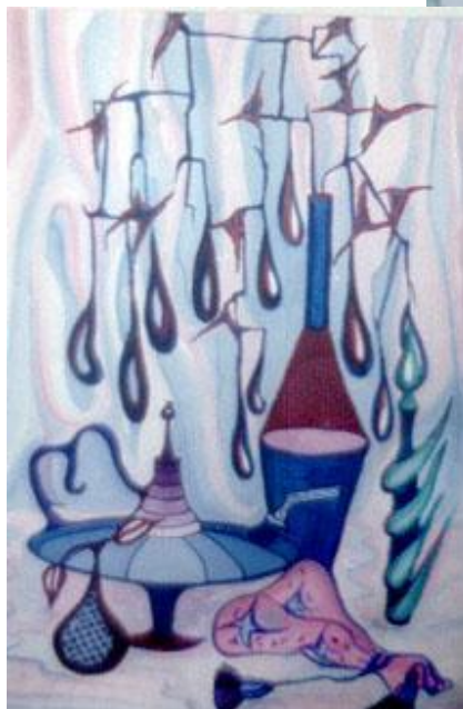
Панно «Загадка сна» Шелк – свободная роспись