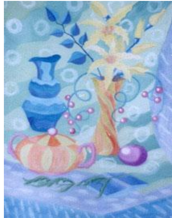
Панно «Натюрморт с лилиями» Лен – горячий батик