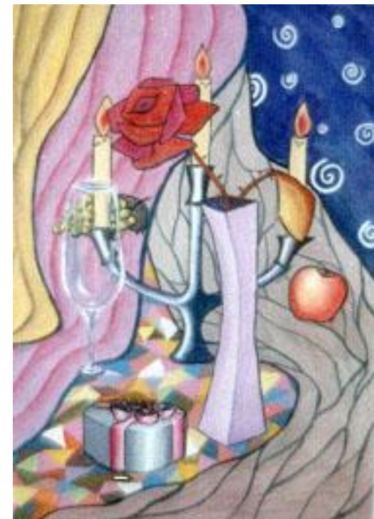
Панно «Натюрморт с розой»