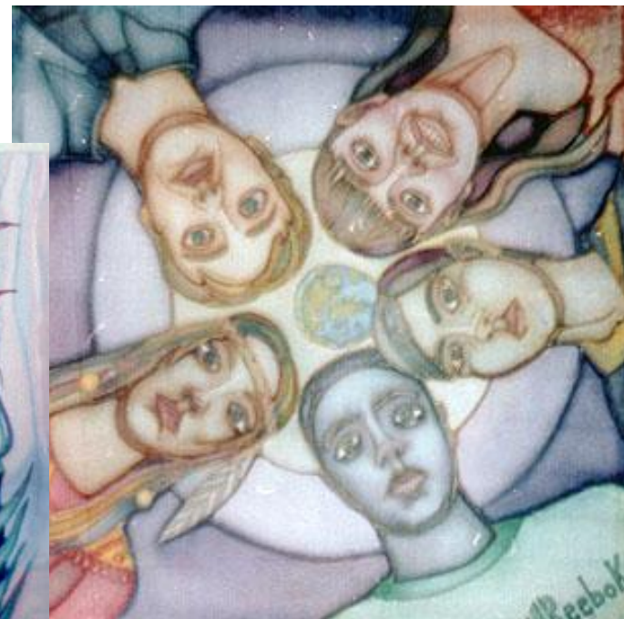
Панно «Дружба» Хлопок – свободная роспись