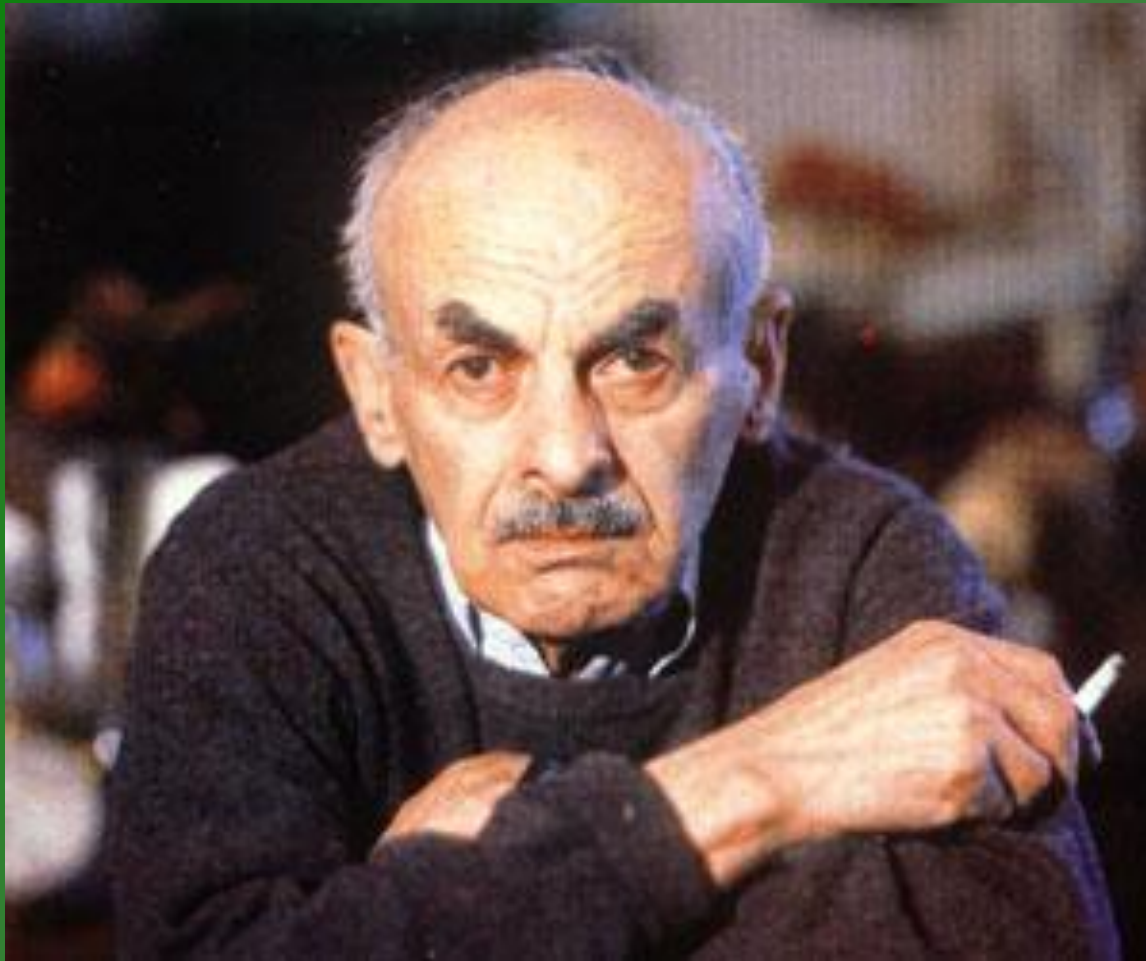
Булат Окуджава (1924-1997)

Участник войны, добровольцем ушёл на фронт.