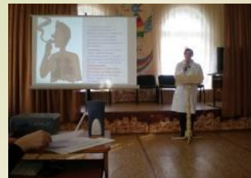
«Сигарета – не конфета» общешкольное мероприятие