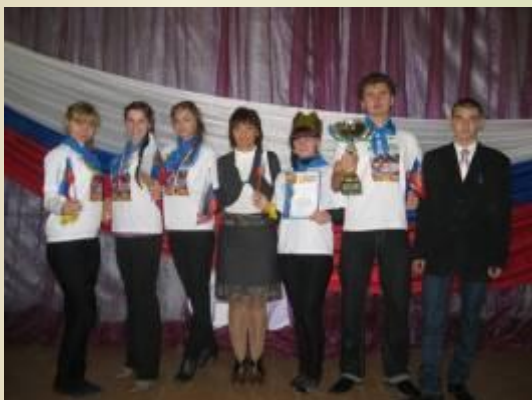
Олимпиада по основам избирательного законодательства