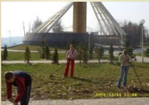
Уборка Мемориального комплекса