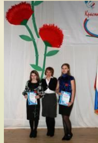
Фестиваль «Достояние республики», 2011 г.