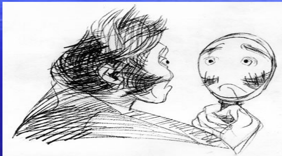
Коллежский асессор, майор Ковалев