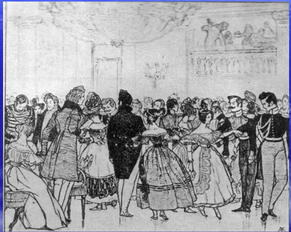
Сон Пискарева Кардовский 1904г.