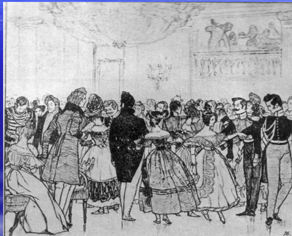
Сон Пискарева Кардовский 1904г.