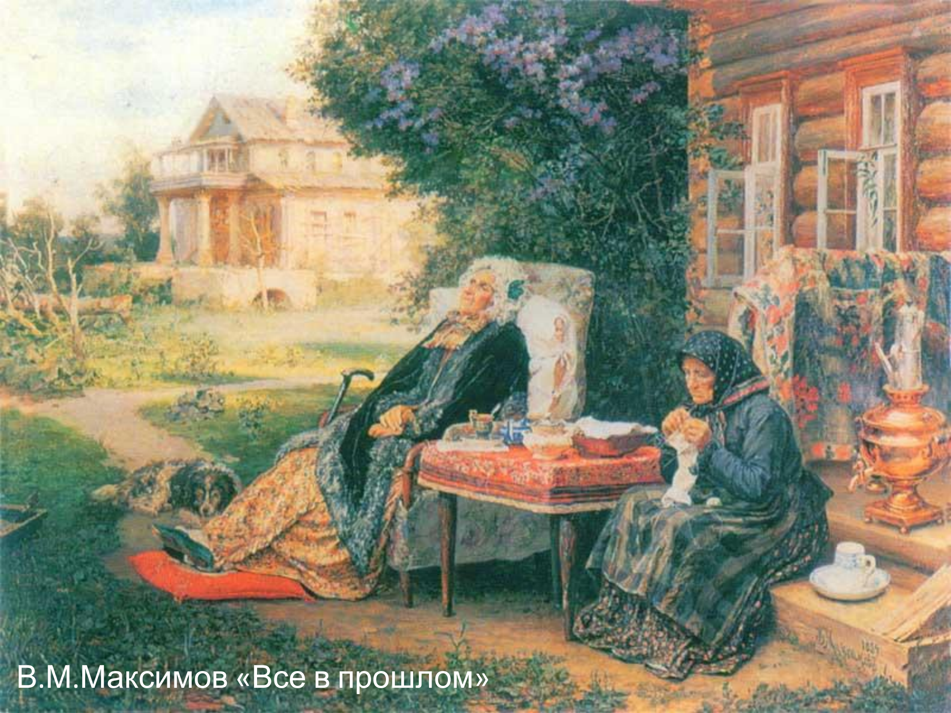
В.М.Максимов «Все в прошлом»