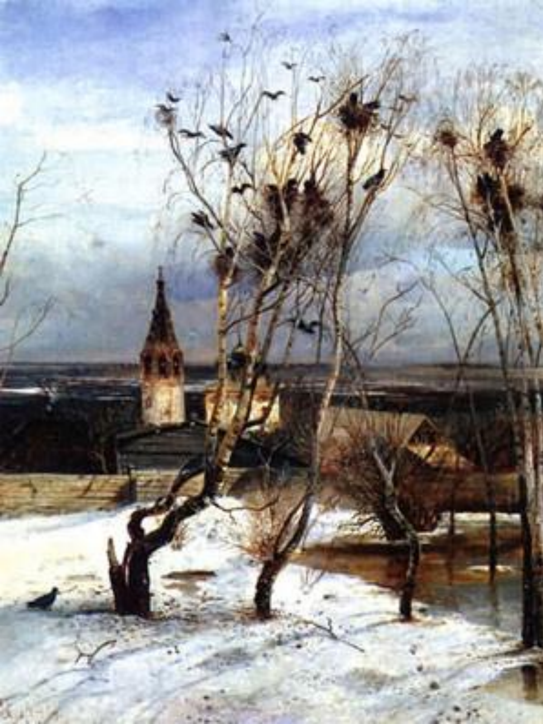
А.К.Саврасов «Грачи прилетели»