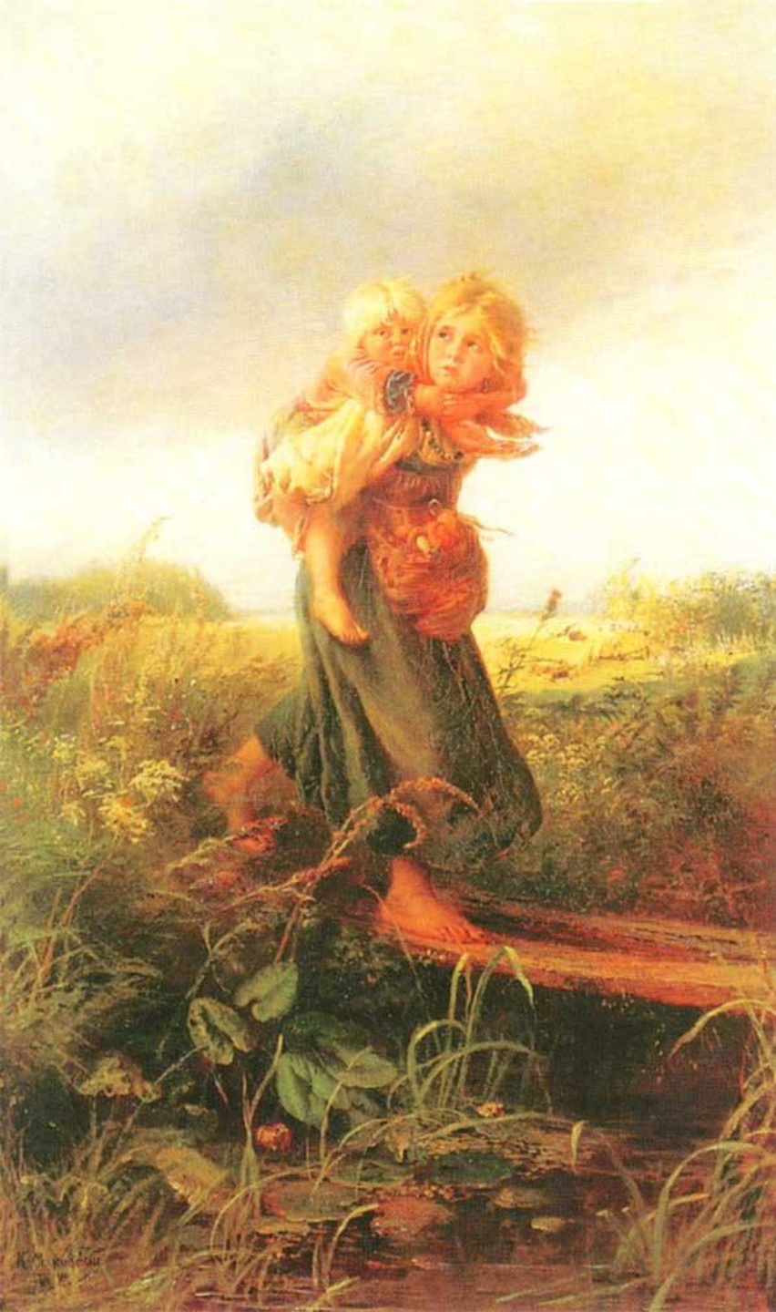
К.Е. Маковский «Дети, бегущие от грозы»