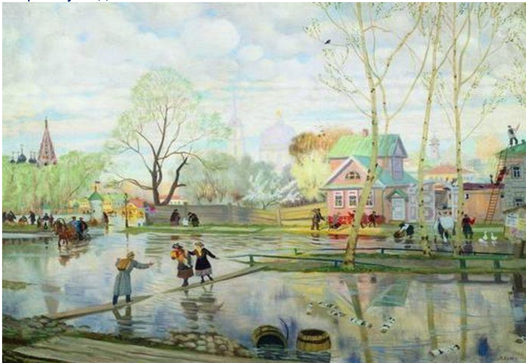
Борис Кустодиев. «Весна»