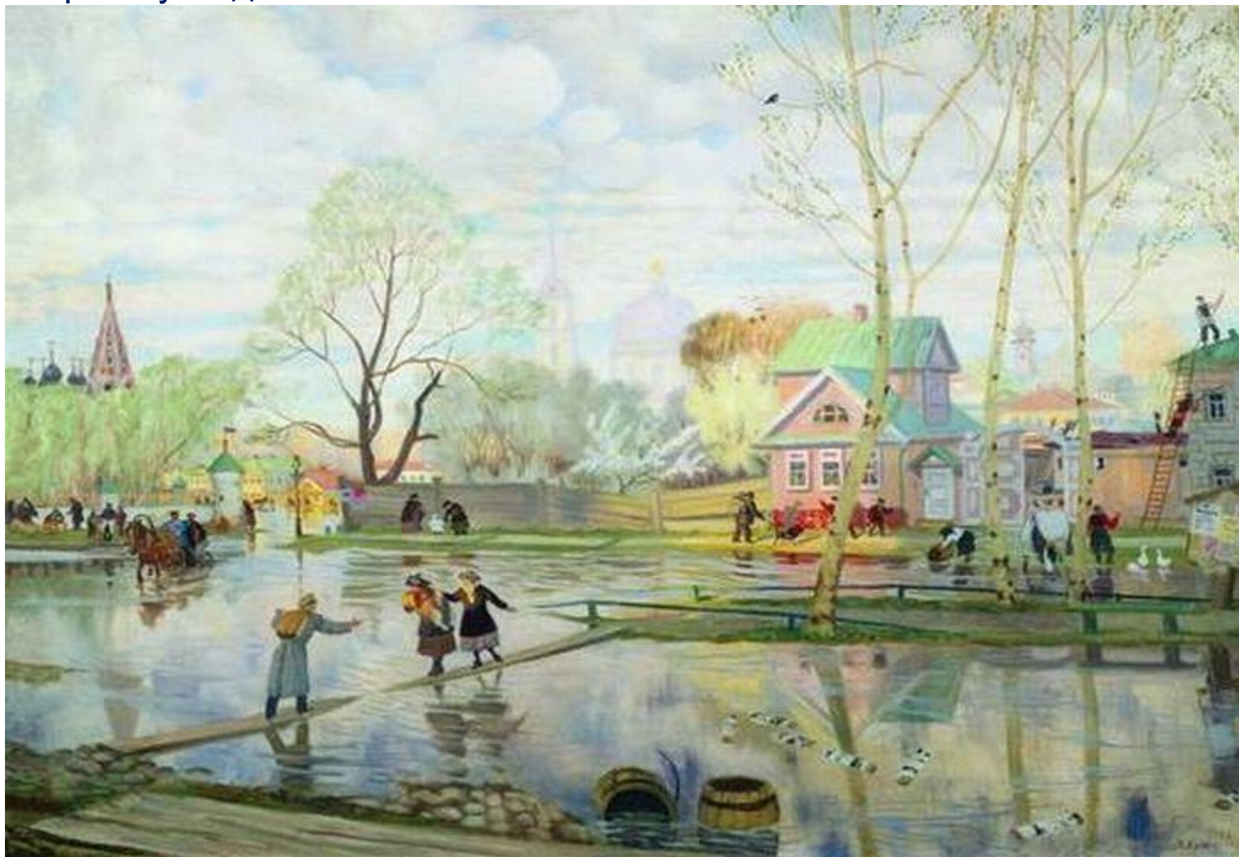
Борис Кустодиев. «Весна»