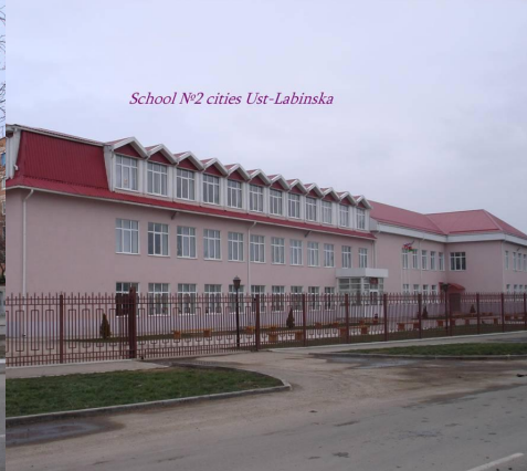
The Building 1850. It Is Reconstructed 2005