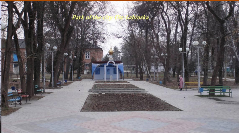
Park of the city Ust-Labinska