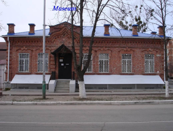
School №2 cities Ust-Labinska