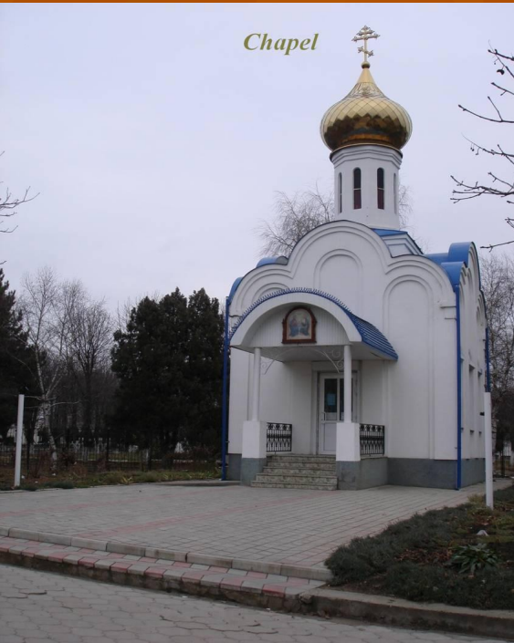
Park of the city Ust-Labinska