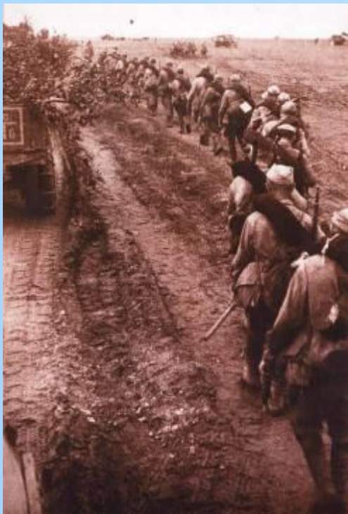
На передовые. Июнь 1941 года.