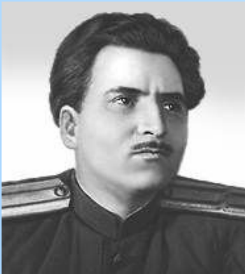
Константин Симонов (1915 – 1979)