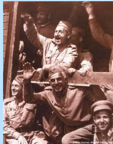
Домой с Победой. 1945.