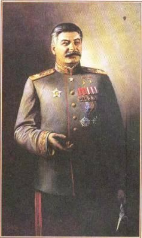
Василий Яковлев. Портрет И.В.Сталина

Товарищи, разрешите мне поднять ещё один, последний тост.