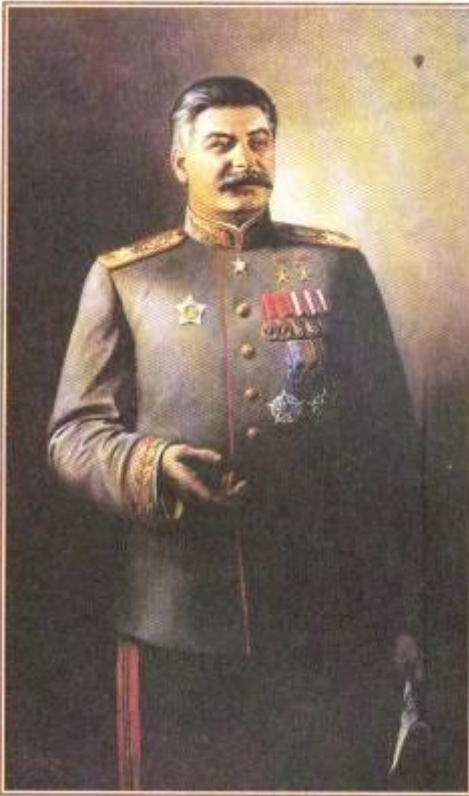
Василий Яковлев. Портрет И.В.Сталина

Товарищи, разрешите мне поднять ещё один, последний тост.