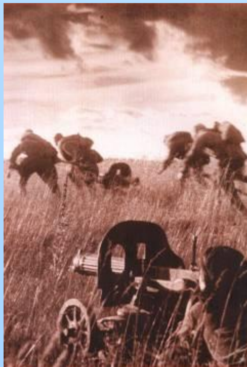
Лето сорок третьего