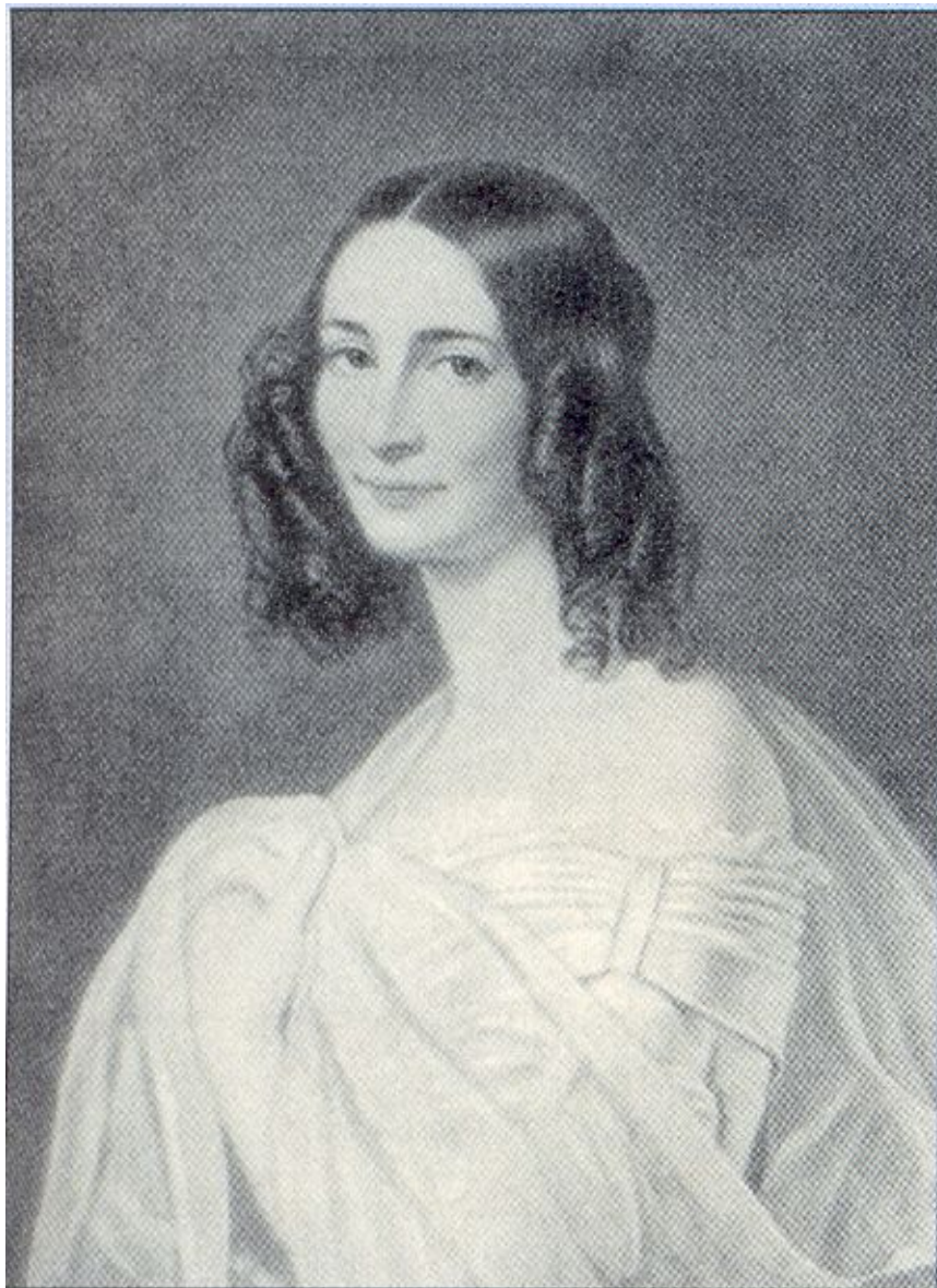
Эрнестина Тютчева. 1840-е гг.