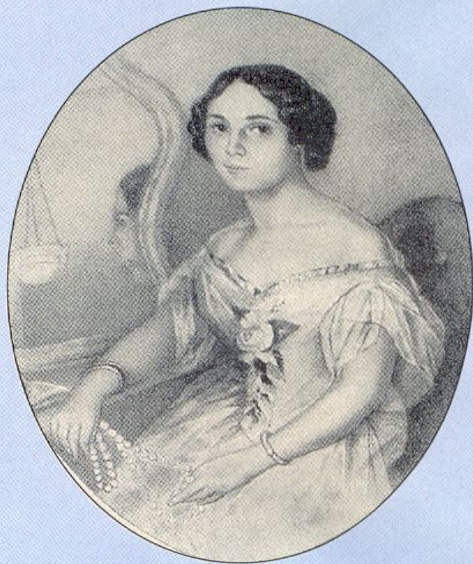
Елена Денисьева. Начало 1850-х гг.