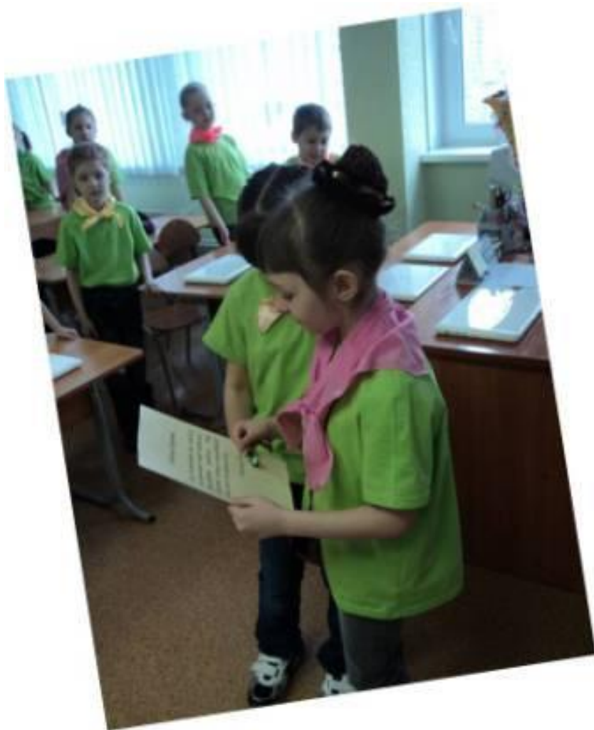
Чтение послания от пиратов