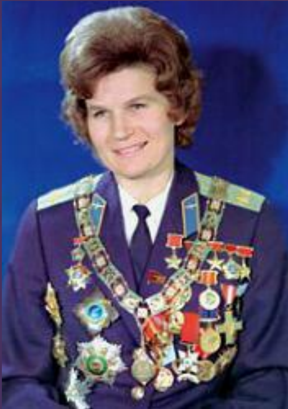
Терешкова Валентина Владимировна