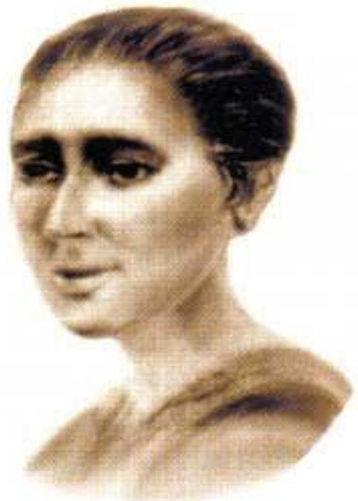
Мария (Татьяна) Федоровна Прончищева (1713-1736 гг.) - первая в мире полярная путешественница, участница Великой Северной экспедиции.