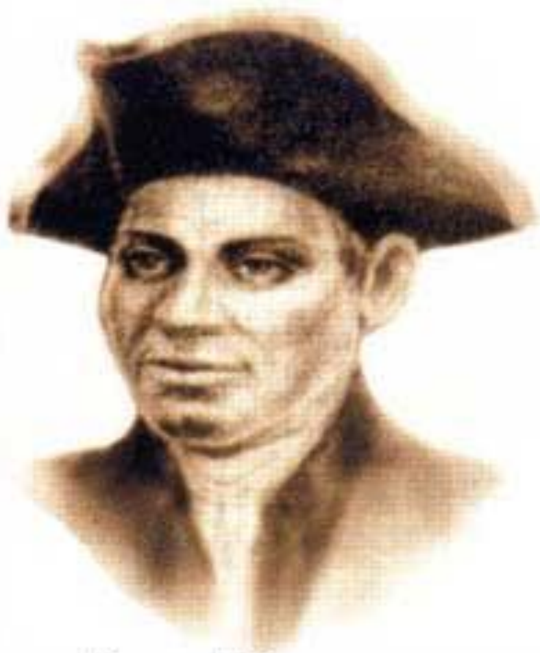
Василий Васильевич Прончищев (1702-1736 гг.) - лейтенант, начальник Ленско-Хатангского отряда Великой Северной экспедиции (1733-1743 гг.).