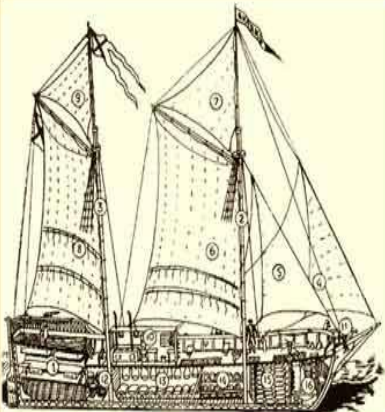
Схема дубель-шлюпа "Якуцк", на котором исследовал побережье Северного Ледовитого океана Ленско-Хатангский отряд (П. П. Яеловский. Летопись города Якутска..., Якутск, 2002, стр. 119).

Цифрами обозначены: 1 - офицерский кубрик; 2 - фок- мачта с оснасткой; (рангоутом и такелажем); 3 - грот-мачта с оснасткой; 4 - кливер; 5 - стак- сель; 6 - фок; 7 - фока-топсель; 8 - грот; 9 - грота-топсель; 10 - офицерский камбуз и штурман- ская; 11 - отхожее место; 12 - кройт-камера, винные запасы; 13 - жилой трюм для рядового состава; 14, 15 - продовольственные, запасы амуниции, пресной воды; 16 - канаты, пируса, таке- лажная