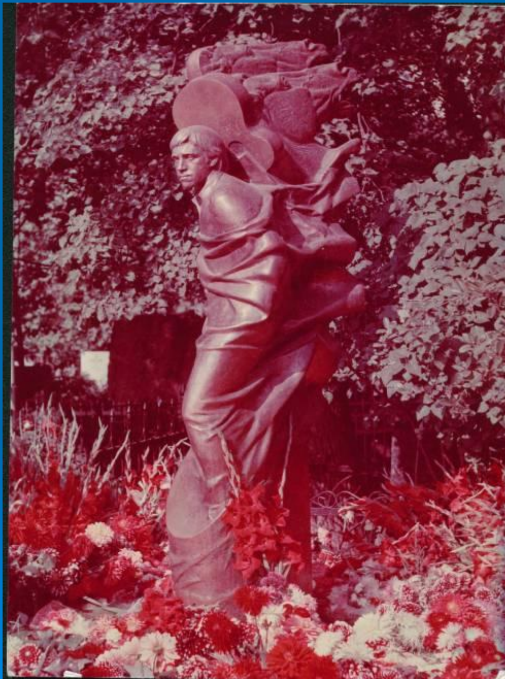
Могила В.С. Высоцкого в Москве на Ваганьковском кладбище