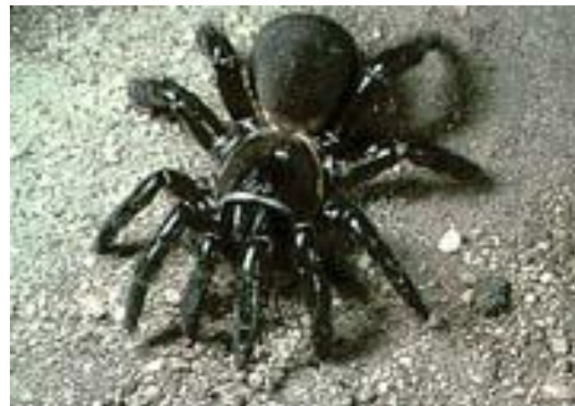
Паук – «арканщик»