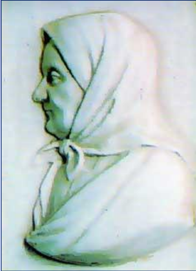
Я.П. Серяков Барельеф Арины Родионовны Работа по кости 1840-е гг.

После окончания лица Пушкин был определен в коллегию иностранных дел. Но работать ему почти не удалось, почти всю свою жизнь А.С. Пушкин посвятил творчеству. Большую роль в этом сыграли его бабушка и , особенно, няня Арина Родионовна.