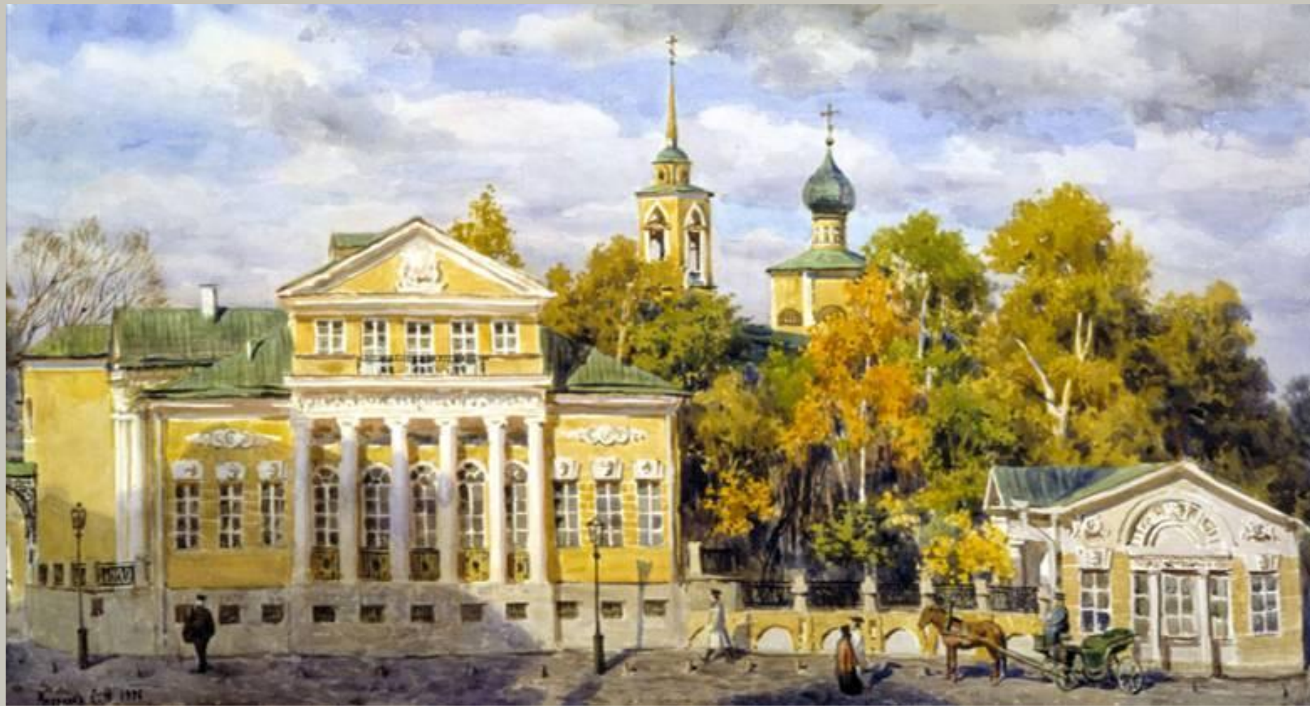
Музей А.С. Пушкина на Пречистенке - усадьба Хрущевых-Селезневых. Рисунок XIX в.