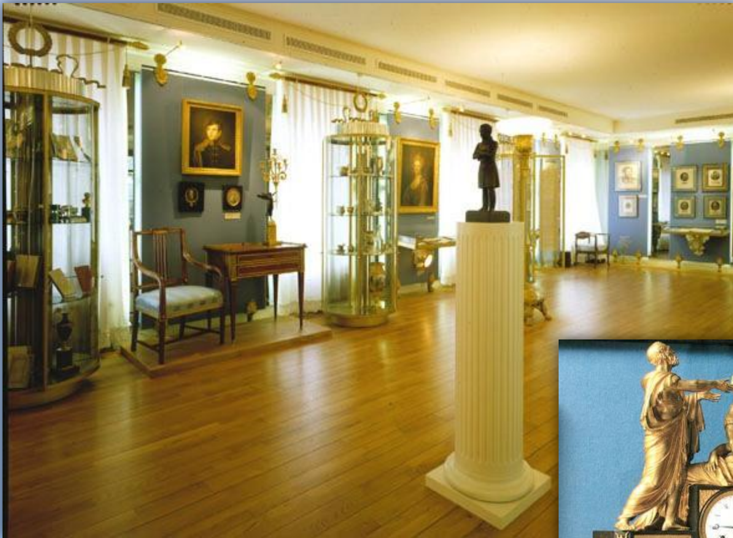
Зал «Эпоха Пушкина (1799-1837)»