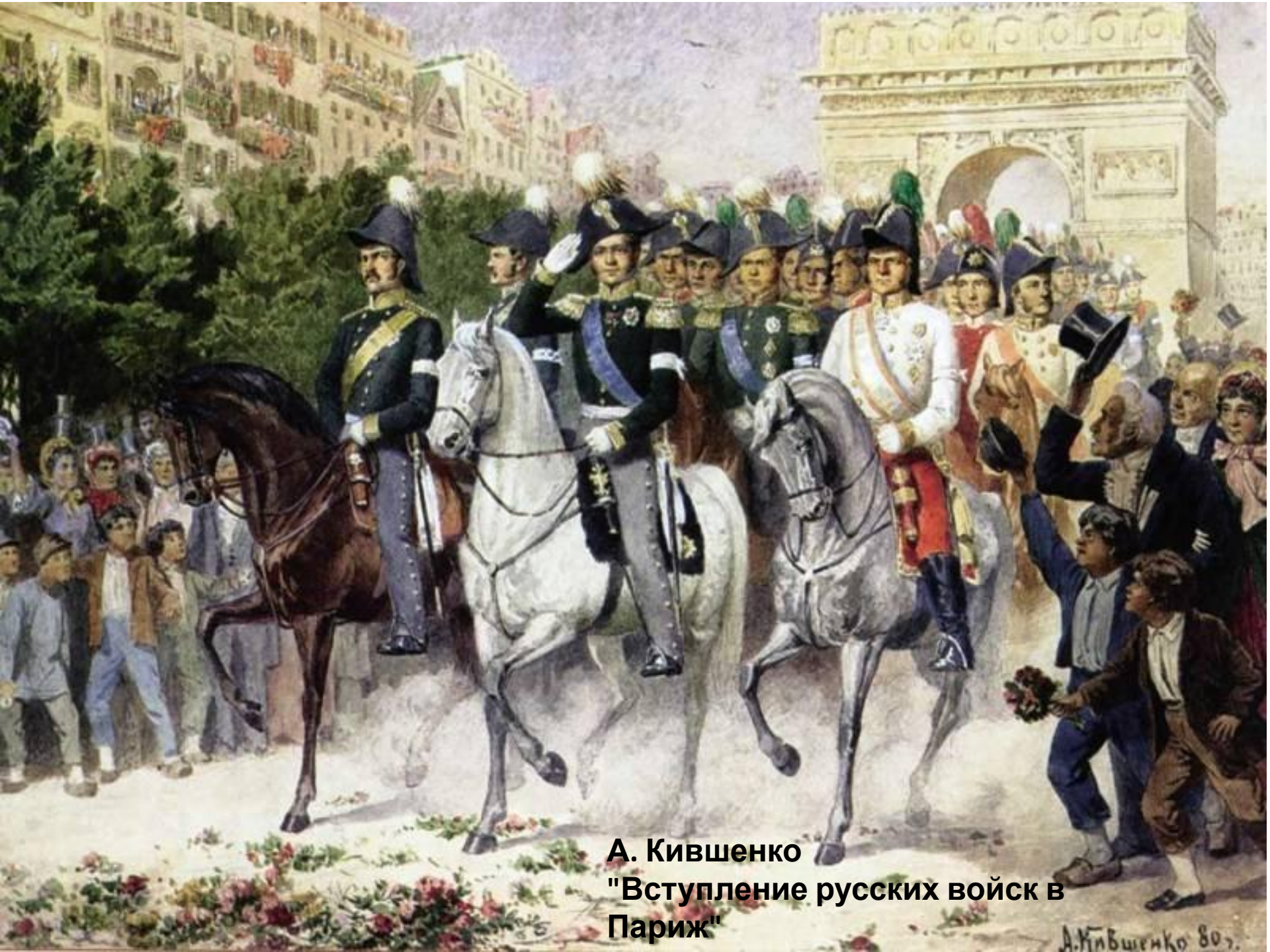
А. Кившенко "Вступление русских войск в Париж"