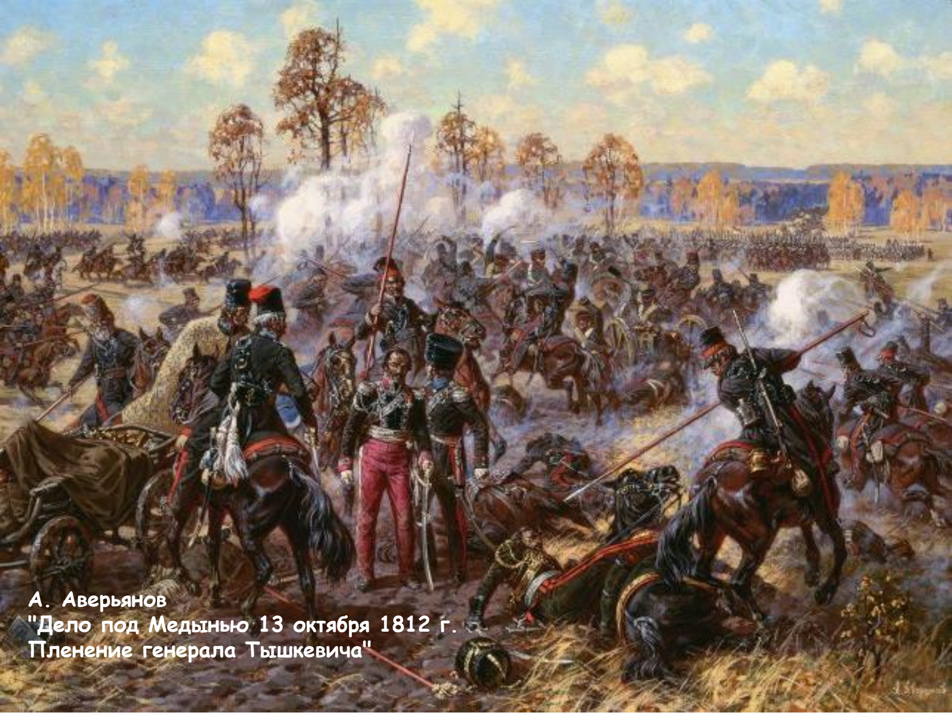
А. Аверьянов "Дело под Медынью 13 октября 1812 г. Пленение генерала Тышкевича"