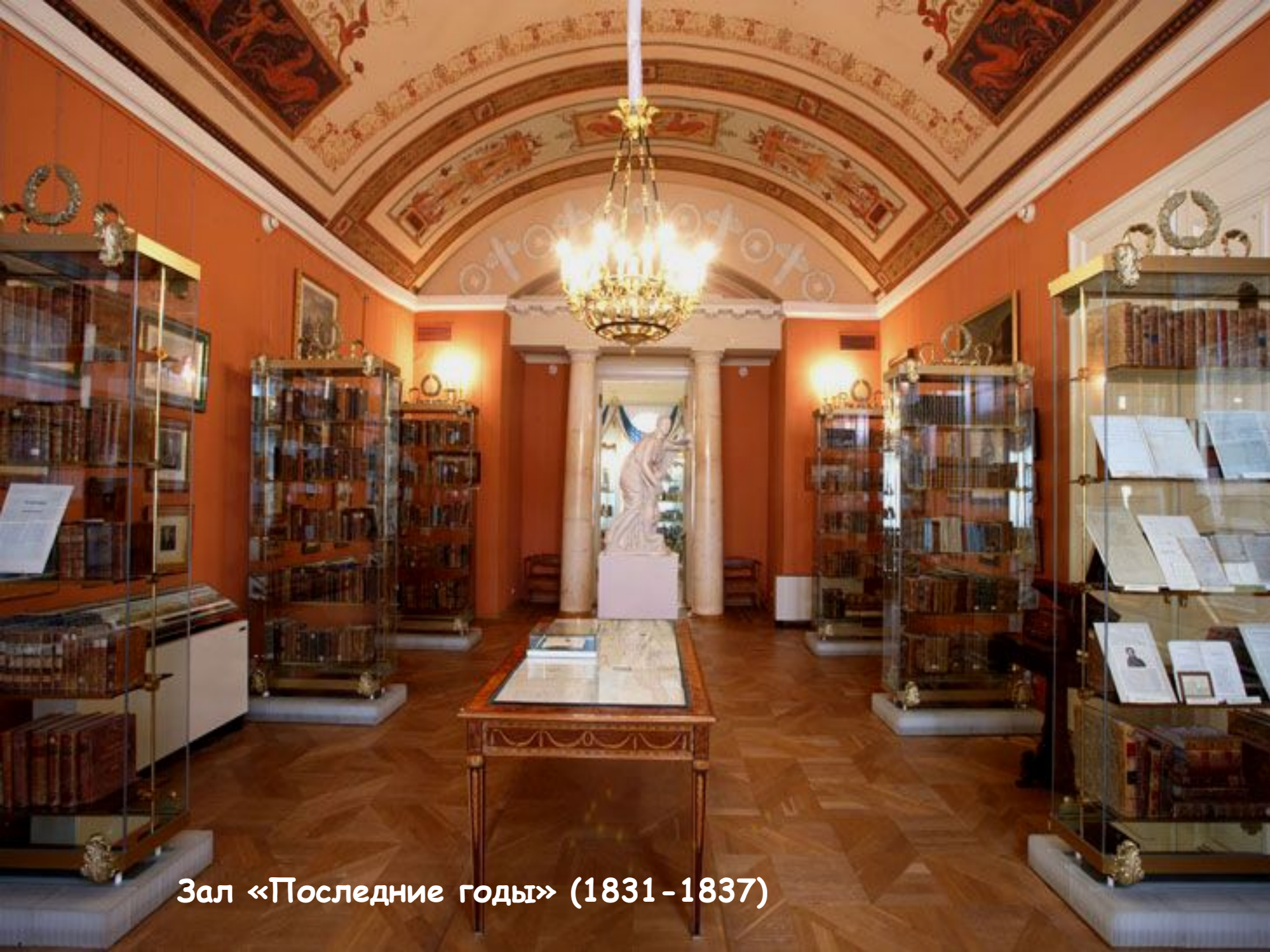
Зал «Последние годы» (1831-1837)