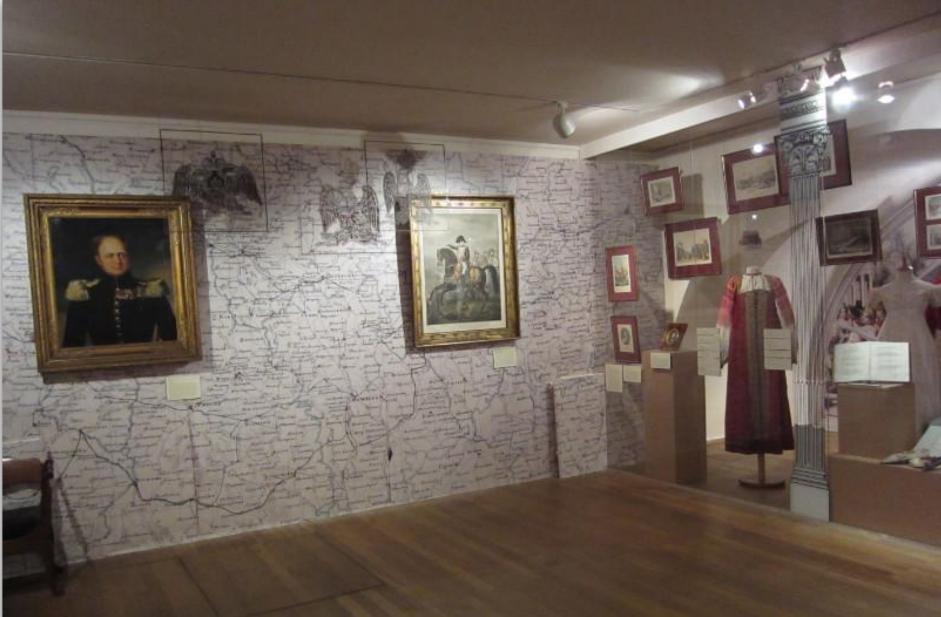
Карта военных действий, портреты Наполеона и Александра I предметы быта того времени