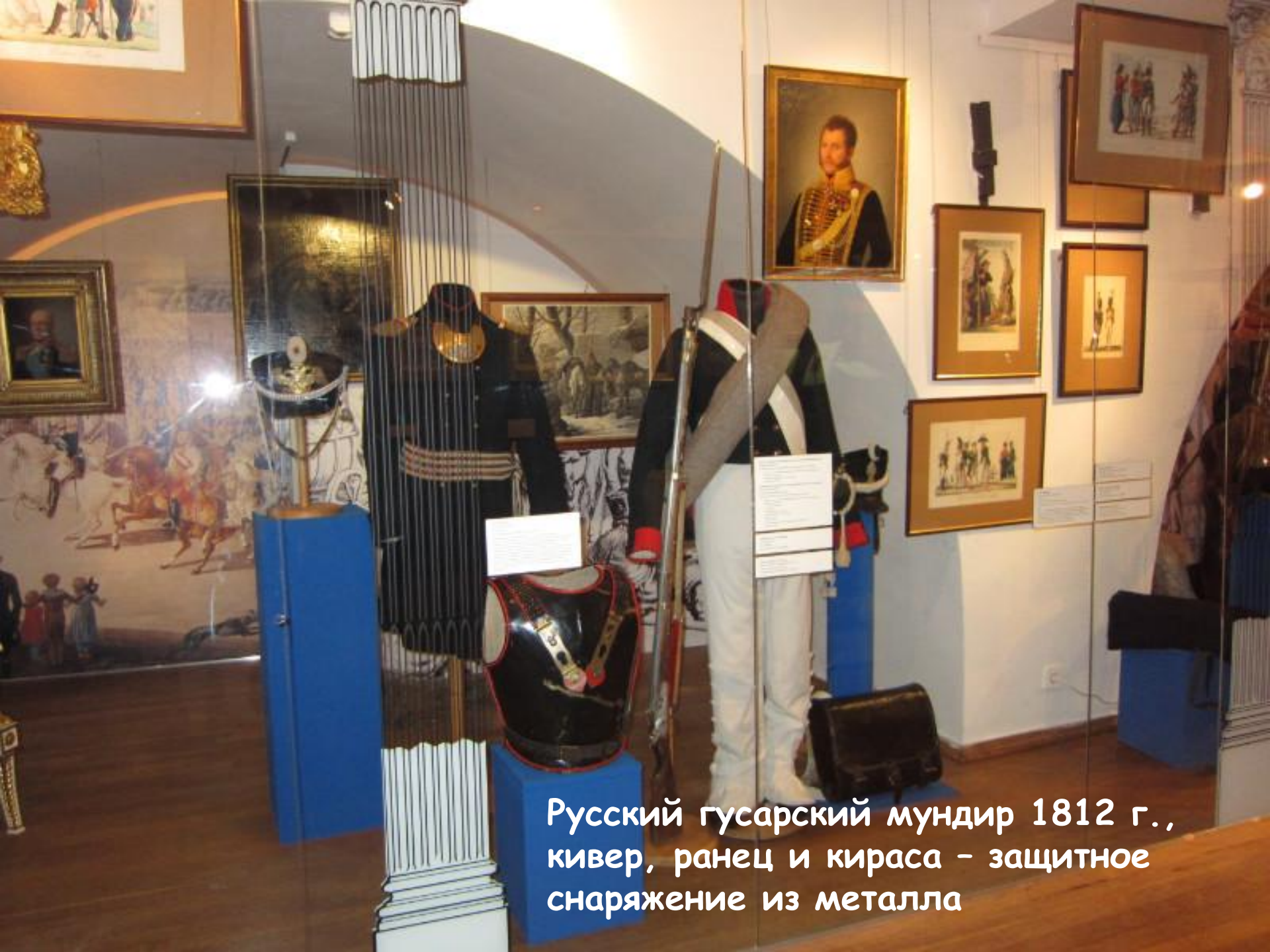
Русский гусарский мундир 1812 г., кивер, ранец и кираса – защитное снаряжение из металла