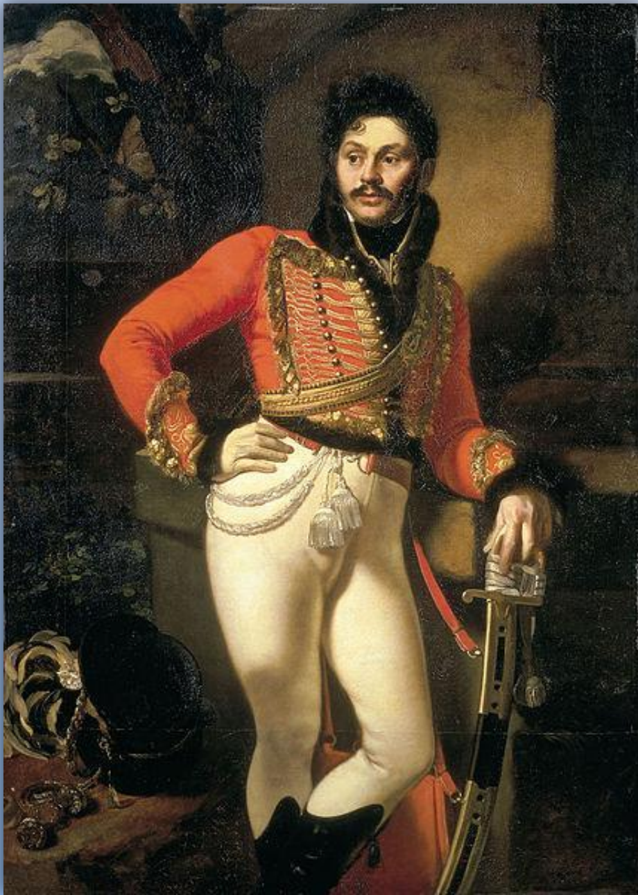
О. Кипренский. Портрет Д. Давыдова

Тебе, певцу, тебе, герою! Не удалось мне за тобою При громе пушечном, в огне Скакать на бешеном коне. Наездник смирного Пегаса, Носил я старого Парнаса Из моды вышедший мундир: Но и по этой службе трудной, И тут, о мой наездник чудный, Ты мой отец и командир.