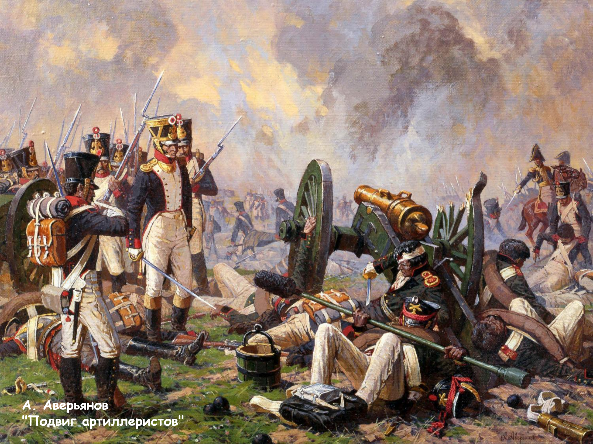
А. Аверьянов "Подвиг артиллеристов"