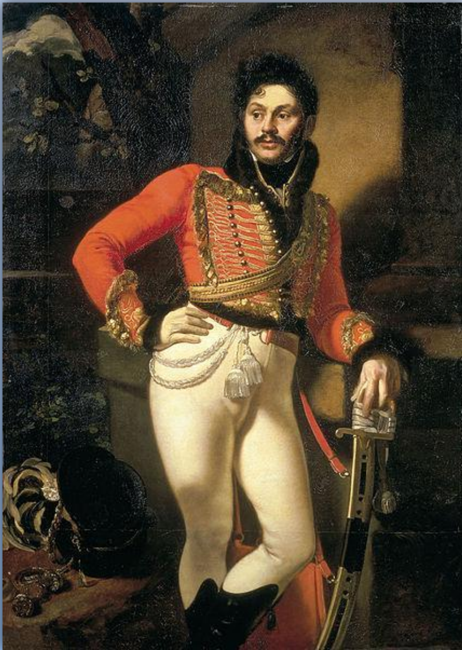
О. Кипренский. Портрет Д. Давыдова

Тебе, певцу, тебе, герою! Не удалось мне за тобою При громе пушечном, в огне Скакать на бешеном коне. Наездник смирного Пегаса, Носил я старого Парнаса Из моды вышедший мундир: Но и по этой службе трудной, И тут, о мой наездник чудный, Ты мой отец и командир.