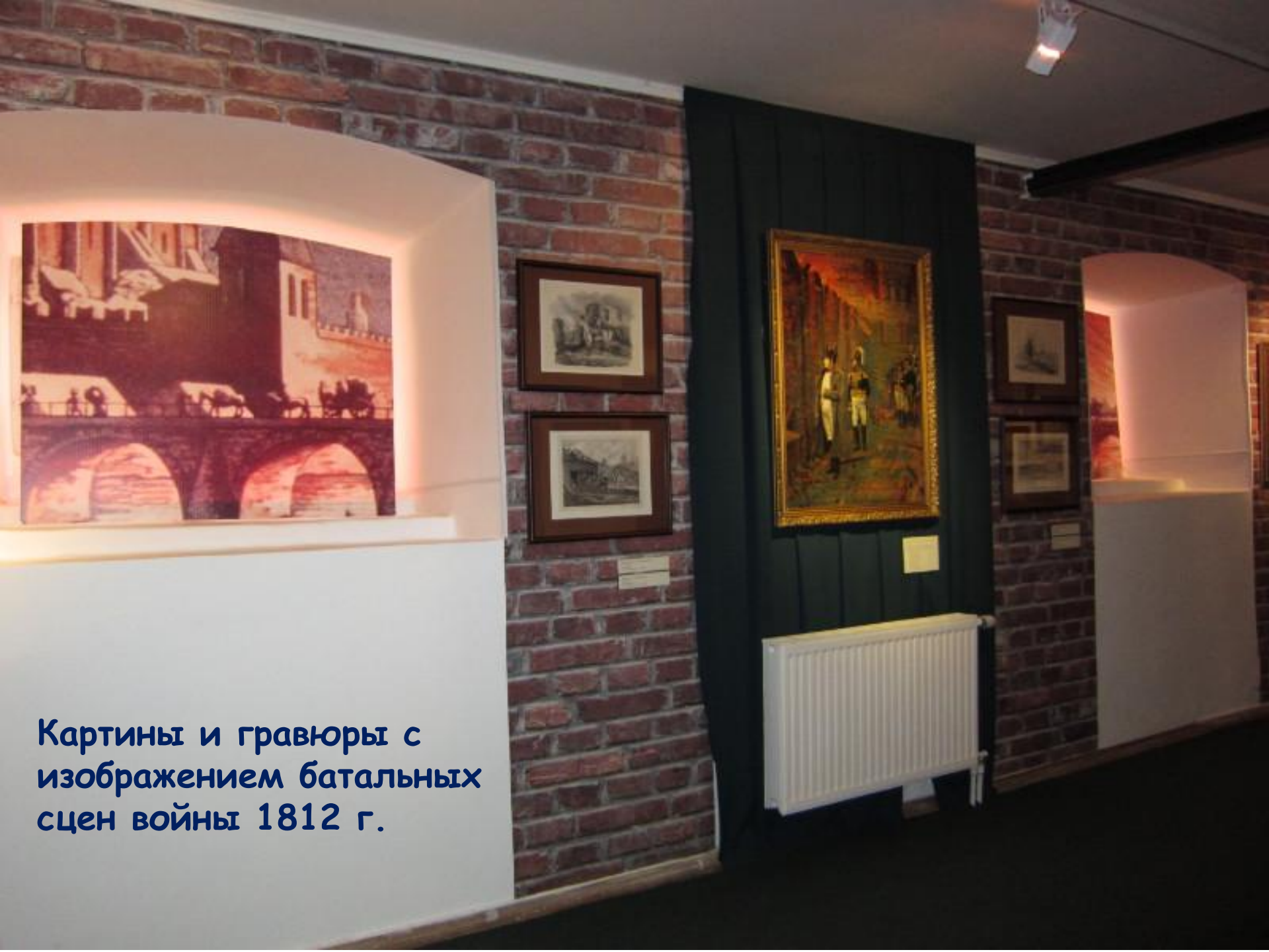
Картины и гравюры с изображением батальных сцен войны 1812 г.