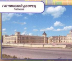
ГАТЧИНСКИЙ ДВОРЕЦ Гатчина