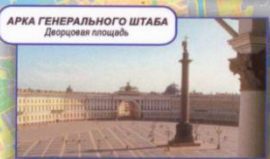
АРКА ГЕНЕРАЛЬНОГО ШТАБА Дворцовая площадь