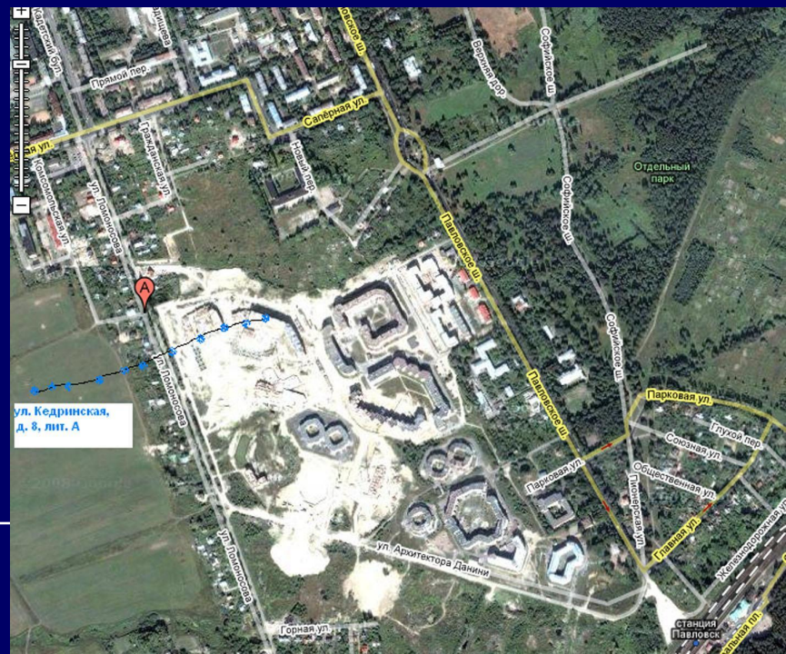
ул. Кедринская, д. 8, лит. А