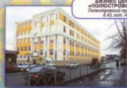
БИЗНЕС ЦЕНТР «ПОЛУСТРОВСКИЙ» Полустровский проспект, д. 43, лит. А