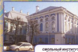
СМОЛЬНЫЙ ИНСТИТУТ Смолярный проезд, д. 1/3