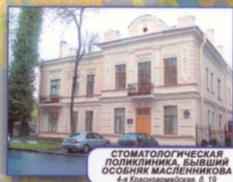
СТОМАТОЛОГИЧЕСКАЯ ПОЛИКЛИНИКА БЫВШИЙ ОСОБНЯК МАСТЕННИКОВА 4-я Красноармейская, б. 19