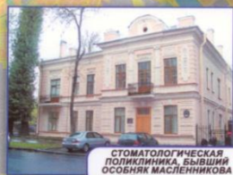
СТОМАТОЛОГИЧЕСКАЯ ПОЛИКЛИНИКА, БЫВШИЙ ОСОБНЯК МАСТЕННИКОВА 4-я Красноармейская, б. 19