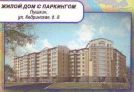
ЖИЛОЙ ДОМ С ПАРКИНГОМ Пушкин, ул. Кедринская, д. 8