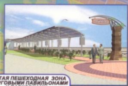
КРЫТАЯ ПЕШЕХОДНАЯ ЗОНА С ТОРГОВЫМИ ПАВИЛЬОНАМИ И ПАРКОВКАМИ проспект Зенитский