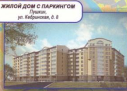
ЖИЛОЙ ДОМ С ПАРКИНГОМ Пушкин, ул. Кедринская, д. 8