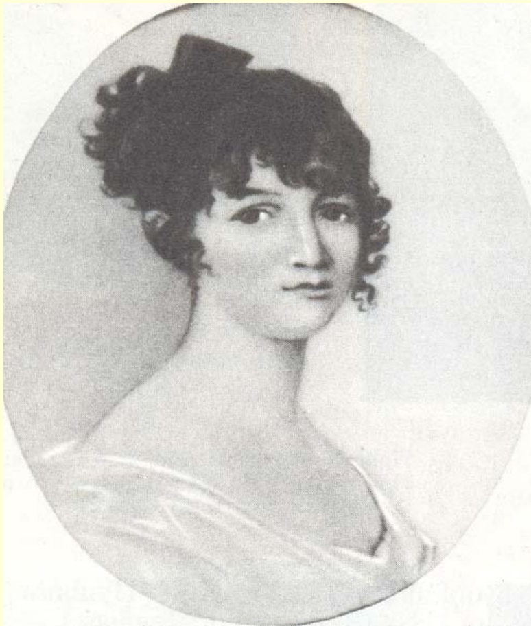
Надежда Осиповна Пушкина, мать поэта