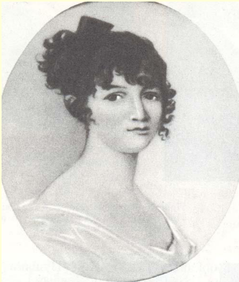
Надежда Осиповна Пушкина, мать поэта