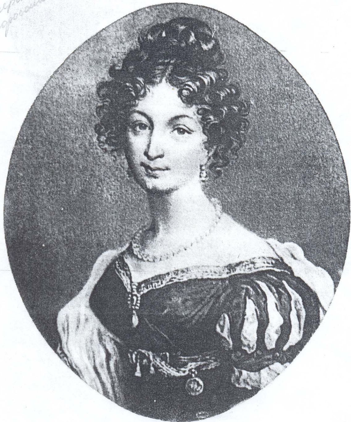
Елизавета Ксаверьевна Воронцова, жена генерал-губернатора Новороссии, 1823 г.