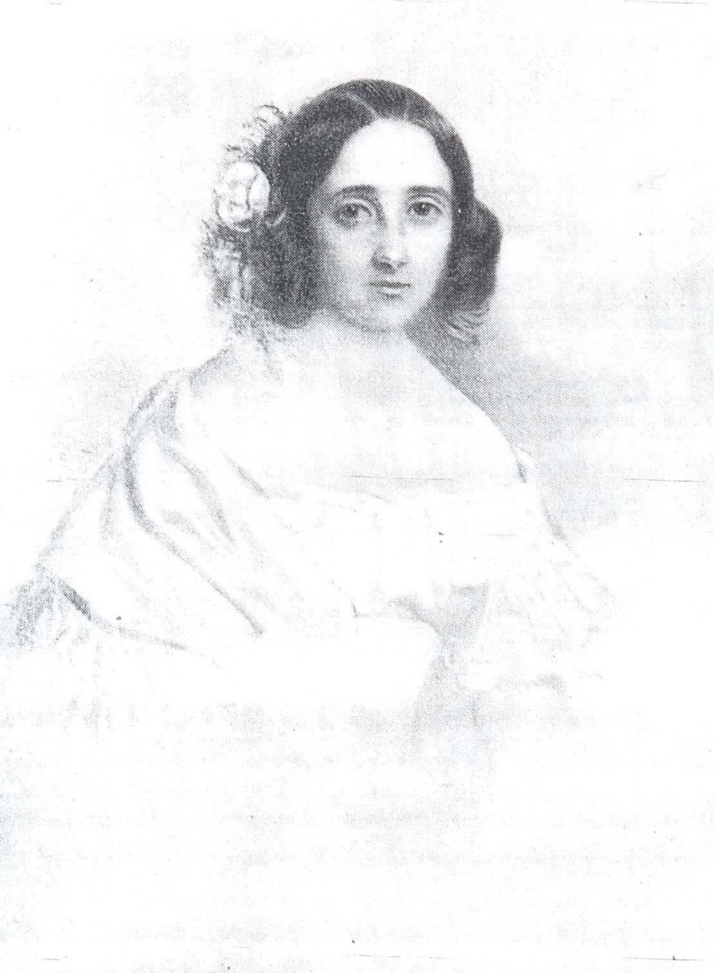
Анна Алексеевна Оленина