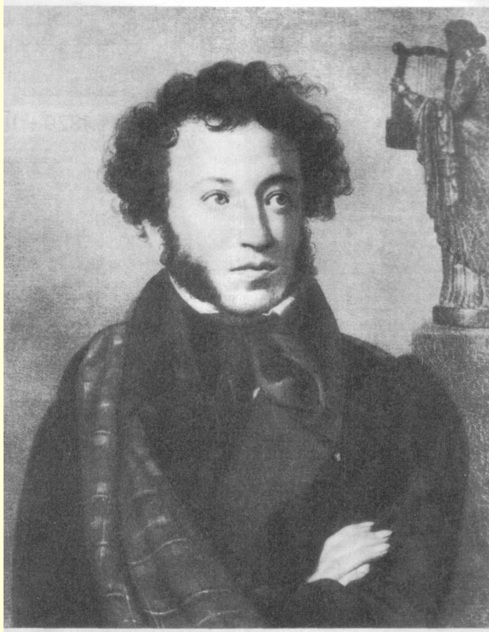
А. С. Пушкин, 1827 г.