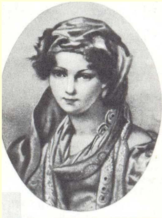
М. Н. Раевская, 1820 г.