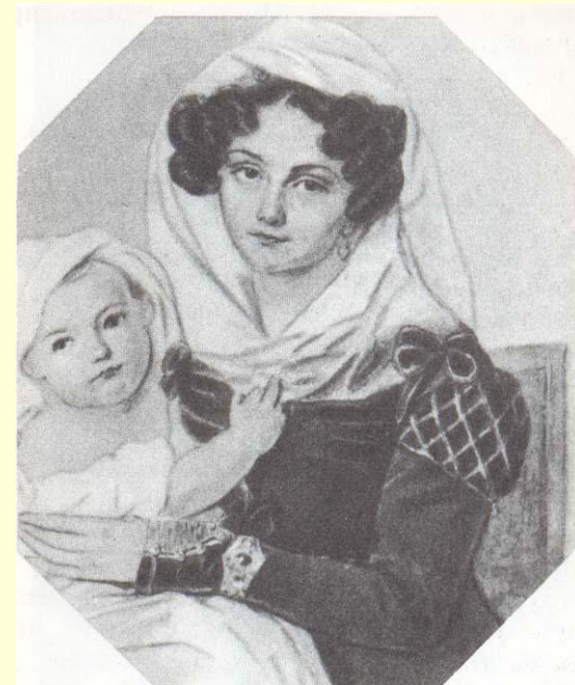
М. Н. Волконская с сыном, 1826 г.