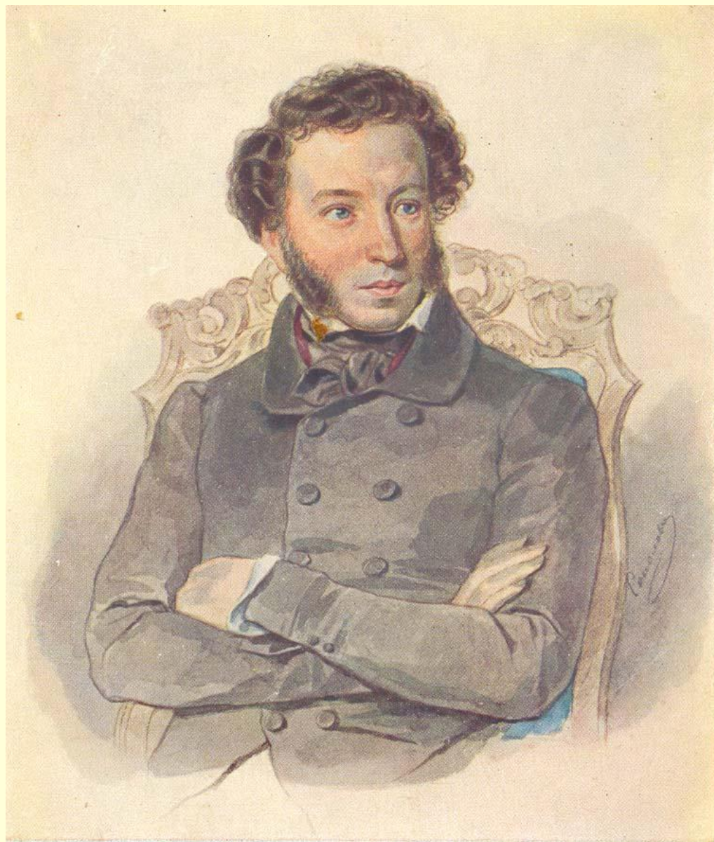
Александр Сергеевич Пушкин