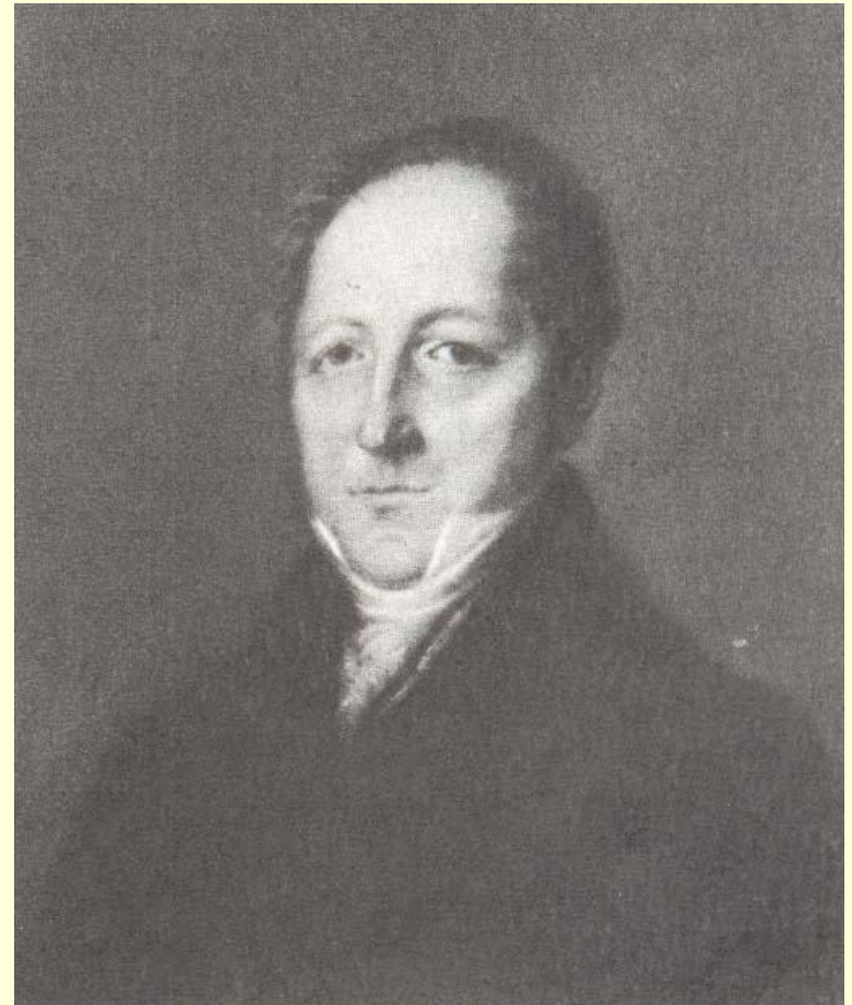
Сергей Львович Пушкин, отец поэта