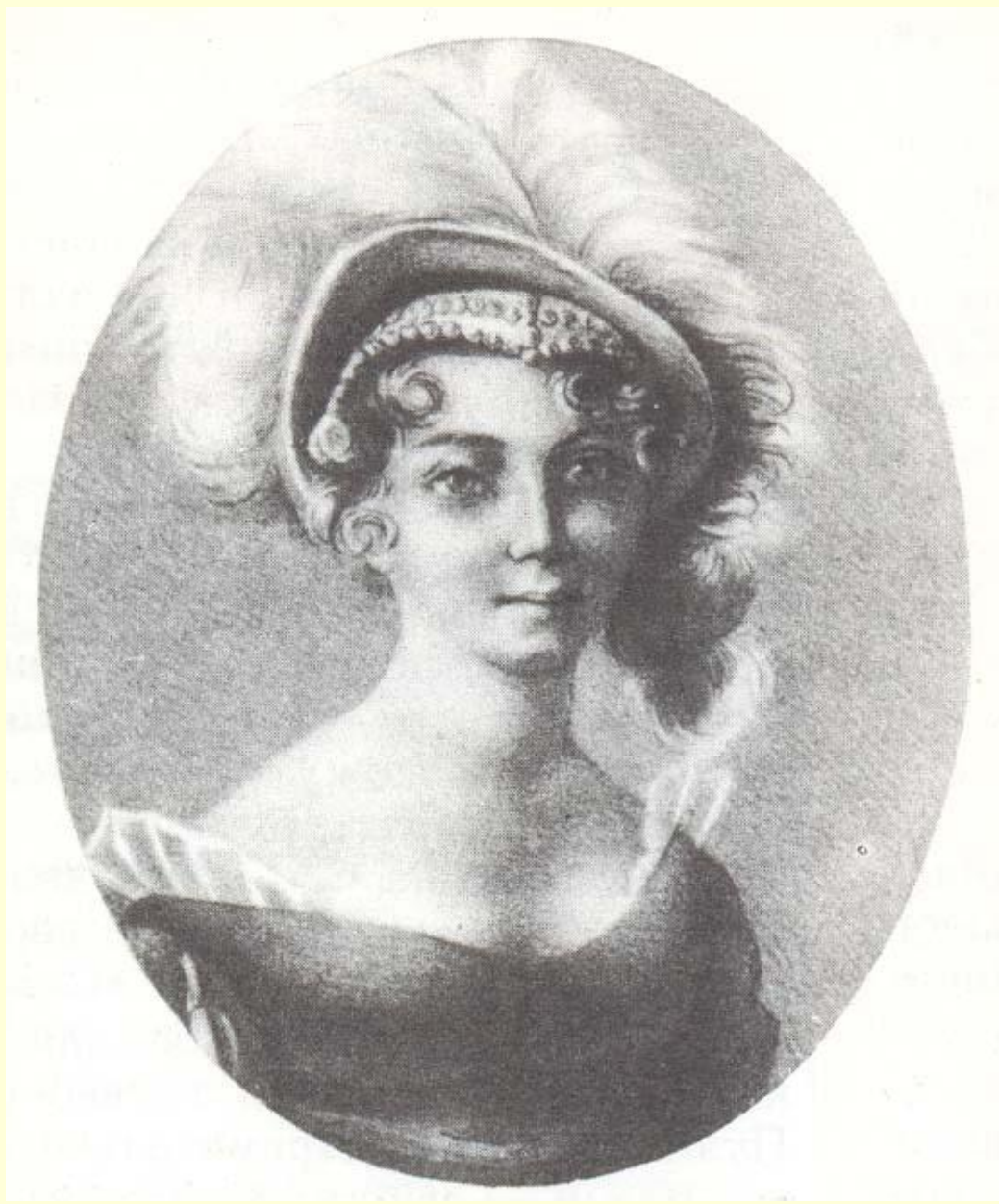
«Царица муз и красоты» - княгиня З. А. Волконская, 1827 г.