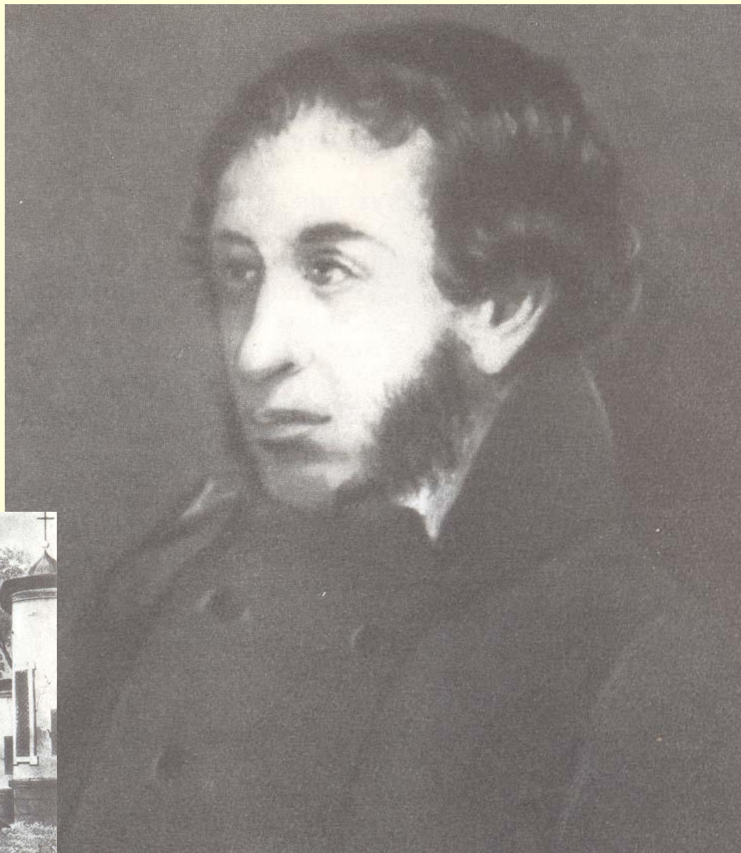
А. С. Пушкин, 1836-37