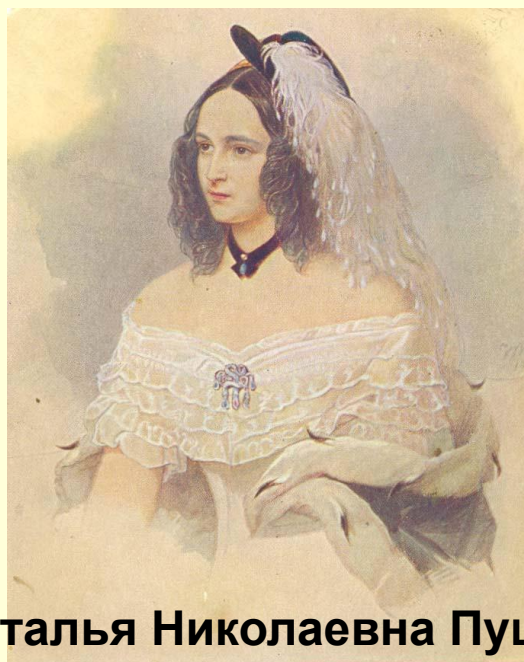
Наталья Николаевна Пушкина