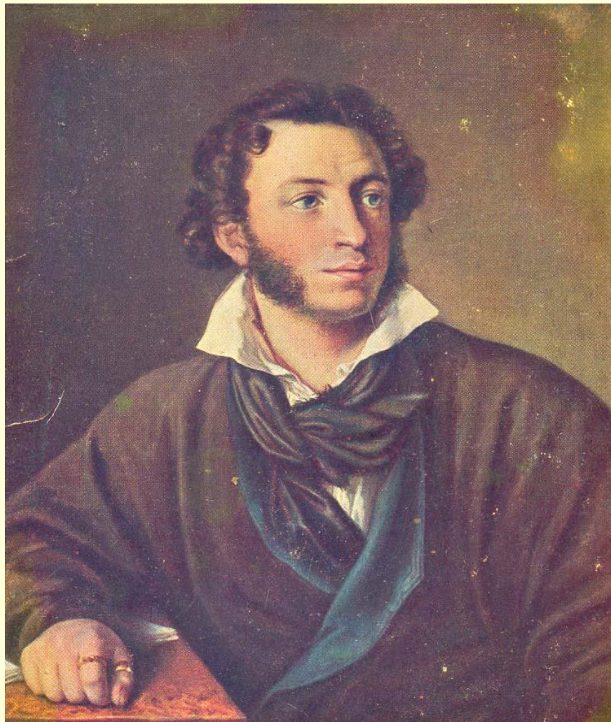
А. С. Пушкин, 1827 г.