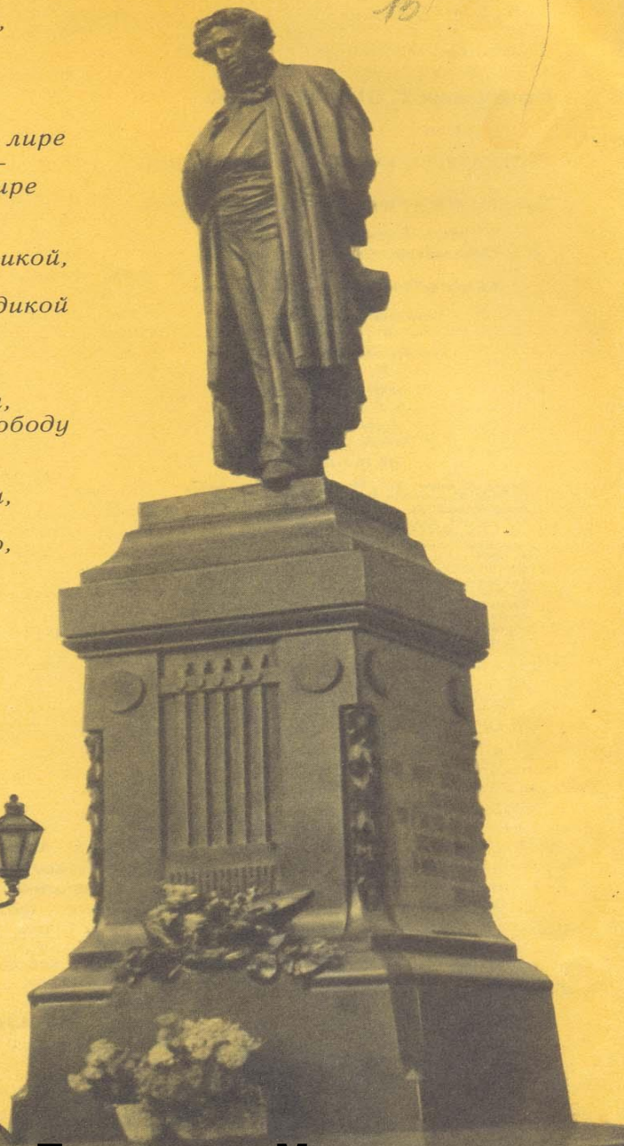
Памятник Пушкину в Москве