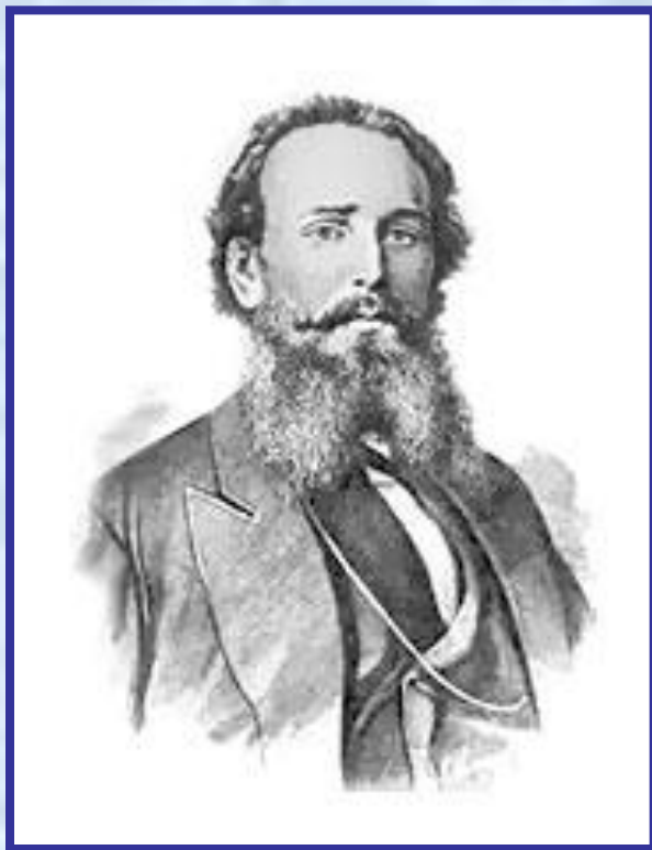
Скульптор Александр Михайлович Опекушин.

Изнурительно-тяжелым был путь сына крепостной надворной советницы к всемирному признанию. Но талант и труд – постоянные спутники Опекушина – помогли ему и получить вольную, и окончить Петербургскую академию художеств. Опекушин выполняет 9 статуй русских деятелей 18 века, скульптуры царя-реформатора Петра-1. И все же изваяние не царя, а поэта стало вершиной творчества Александра Опекушина.