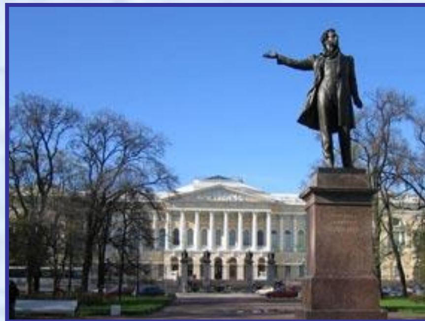
Скульптура М. Аникушина