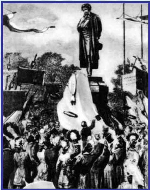
Открытие памятника А.С. Пушкину в Москве. Рис. художника Н.Чехова

В 1872 году был объявлен конкурс на памятник великому поэту России, который продолжался 8 месяцев. Создать памятник первому поэту и самому прославиться в веках хотелось многим скульпторам. Но комиссия утвердила один проект – А.М. Опекушина. Деньги на памятник собирала вся Россия по подписке. Открытие памятника состоялось при огромном стечении народа 6 июня 1880 года в центре Москвы на Тверском бульваре. Оно стало одним из значительных событий общественной жизни в конце 19 века, свидетельством окончательного признания роли Пушкина в отечественной культуре.